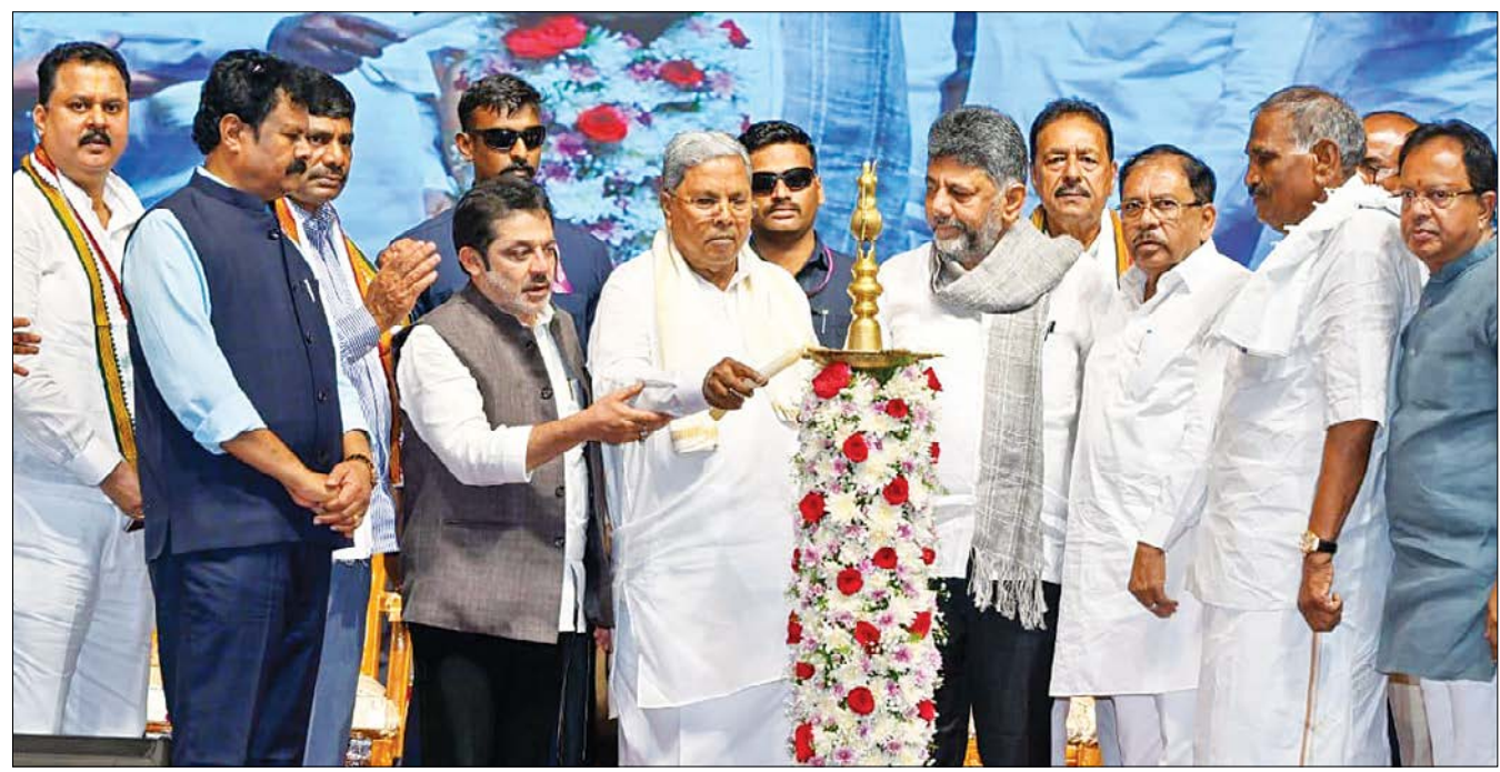
ವಸತಿ ಇಲಾಖೆ, ಕರ್ನಾಟಕ ಗೃಹ ಮಂಡಳಿ ಜಂಟಿಯಾಗಿ ಸೂರ್ಯನಗರದಲ್ಲಿ ಆಯೋಜಿಸಿದ್ದ ಅಂತಾರಾಷ್ಟ್ರೀಯ ಶ್ರೀಚಕ್ರ ಸ್ಥಳೀಯ ಶಂಕುಸ್ಥಾಪನೆ, ಮುಖ್ಯಮಂತ್ರಿಗಳ "ನಮ್ಮ ಮನೆ" ಯೋಜನೆಗೆ ಜಾಲನೆ, ಸೂರ್ಯಶೈನ್, ಸೂರ್ಯ ಡಿವೈನ್ ವಸತಿ ಸಮುಜ್ಜಯ ಕಾಮಗಾರಿಗಳ ಶಂಕುಸ್ಥಾಪನೆ, ವಸತಿ ಯೋಜನೆಗೆ ಭೂಮಿ ನೀಡಿದ ಭೂ ಮಾಲೀಕರಿಗೆ ಸಾಂಕೇತಿಕ ನಿವೇಶನ ಹಂಚಿಕೆ ಕಾರ್ಯಕ್ರಮಗಳನ್ನು ಮುಖ್ಯಮಂತ್ರಿ ಸಿದ್ದರಾಮಯ್ಯ ಅವರು ಉದ್ಘಾಟಿಸಿ, ಶುಭ ಹಾರೈಸಿದರು.

ಬೆಂಗಳೂರು: ರಾಜ್ಯ ಸರ್ಕಾರದ ಶಾಲೆಗಳಲ್ಲಿ ವಿನ್ಯಾಸಗಳ ಕೇಸರಿ ಶಾಲು ಧರಿಸಲು ಅವಕಾಶ ಇಲ್ಲ. ಯಾರಾದರೂ ಹಾಕಿಕೊಂಡು ಬಂದರೆ ಕಾನೂನಿನ ಪ್ರಕಾರ ಕಠಿಣ ಕ್ರಮ ತೆಗೆದುಕೊಳ್ಳಲಾಗುವುದು ಎಂದು ಶಿಕ್ಷಣ ಸಚಿವರು ಬಂಗಾರಪ್ಪ ಅವರು ಶನಿವಾರ ಎಚ್ಚರಿಕೆ ನೀಡಿದ್ದಾರೆ. ಜೂನ್ 1 ರಿಂದ ರಾಜ್ಯಾದ್ಯಂತ ಶಾಲೆಗಳು ಆರಂಭವಾಗಲಿವೆ, ಮತ್ತೆ ಹಿಜಾಬ್ ಹಾಗೂ ಕೇಸರಿ ಶಾಲು ಸದ್ದು ಮಾಡುತ್ತಿವೆ. ವಿಚಾರವಾಗಿ ಮಾತನಾಡಿದ ಶಿಕ್ಷಣ ಸಚಿವರು, ಹಿಜಾಬ್ ವಿಚಾರದಲ್ಲಿ ನಮ್ಮ ಸ್ಪಷ್ಟತೆ ಇದೆ. ಹಿಜಾಬ್ ಬಗ್ಗೆ ನಾವು ನಮ್ಮ ಪ್ರಕಾಶಕೆಯಲ್ಲೇ ಹೇಳಿದ್ದೇವು. ಜನರು ಮತ ಕೊಟ್ಟಿದ್ದಾರೆ, ಅದಕ್ಕಾಗಿ ಅವರ ಋಣ ತೀರಿಸಿದ್ದೇವೆ ಎಂದರು. ಬಿಜೆಪಿಯವರಿಗೆ ಅದು ಹಿಜಾಬ್, ನಮಗೆ ಅದು ಸಮಾನತೆಯ ಸಂಕೇತ ಎಂದು ಸಚಿವರು ಬಂಗಾರಪ್ಪ ಅವರು ಹೇಳಿದ್ದಾರೆ. ರಾಜ್ಯ ಸರ್ಕಾರದ ಯಾವುದೇ ಶಾಲೆಗಳಲ್ಲಿ ಕೇಸರಿ ಶಾಲು ಧರಿಸಲು ಅವಕಾಶ ಇಲ್ಲ. ಯಾರಾದರೂ ಹಾಕಿಕೊಂಡು ಬಂದರೆ ಕಾನೂನಿನ ಪ್ರಕಾರ ಕ್ರಮ ತೆಗೆದುಕೊಳ್ಳುತ್ತೇವೆ. ಕೇಂದ್ರೀಯ ವಿನ್ಯಾಸದಲ್ಲಿ ಯಾವ ರೂಲ್ ಇದೆ ಎಂಬುದನ್ನು ಬಿಜೆಪಿಯವರು ಮೊದಲು ನೋಡಿಕೊಂಡು ಬರಲಿ ಎಂದು ಕಡೆಕಾರಿದ್ದಾರೆ. ಬಿಜೆಪಿಯವರಿಗೆ ಅದು ಹಿಜಾಬ್, ನಮಗೆ ಅದು ಸಮಾನತೆಯ ಸಂಕೇತ ಎಂದು ಸಚಿವರು ಬಂಗಾರಪ್ಪ ಅವರು ಹೇಳಿದ್ದಾರೆ. ಪ್ರಾಥಮಿಕ ತರಗತಿಯಿಂದ 12ನೇ ತರಗತಿಯವರೆಗೆ ಜನಿವಾರ, ಹಿಜಾಬ್, ಶಿವದಾರ, ದುಡ್ಡಾಕ್ಷಿ ಹಾಕಿಕೊಳ್ಳಬಹುದು. ಈಗಾಗಲೇ ಸಾಂಪ್ರದಾಯಿಕವಾಗಿ ಅನುಸರಿಸುವ ಧಾರ್ಮಿಕ ಸಂಕೇತಗಳನ್ನು ಧರಿಸಬಹುದು. ಆದರೆ ಹೊಸದಾಗಿ ಕೇಸರಿ ಶಾಲು ಧರಿಸುವಂತಿಲ್ಲ ಎಂದು ಸಚಿವರು ಹೇಳಿದ್ದಾರೆ.