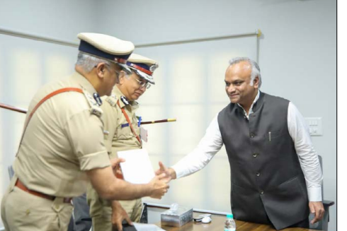
ಪೋಲೀಸ್ ಅಧಿಕಾರಿಗಳೊಂದಿಗಿನ ತಮ್ಮ ಮೊದಲ ಸಭೆಯಲ್ಲಿ ಗೃಹ ಸಚಿವ ಪ್ರಿಯಾಂಕ ಖರ್ಗೆ ಕೆಲ ಮಹತ್ವದ ವಿಚಾರಗಳನ್ನು ಹಂಚಿಕೊಂಡಿದ್ದಾರೆ. ರಾಜ್ಯದಲ್ಲಿ ಮಹಿಳಾ ಸುರಕ್ಷತೆಯ ಕುರಿತು ಹೆಚ್ಚಿನ ಆದ್ಯತೆ ನೀಡುವಂತೆ ಪೋಲೀಸ್ ಇಲಾಖೆ ಅಧಿಕಾರಿಗಳಿಗೆ ಸೂಚನೆ ನೀಡಿದ್ದಾರೆ. "ಮಹಿಳೆಯರಿಗೆ ಏನು ಧರಿಸಬೇಕೆಂದು ಹೇಳುವುದಕ್ಕಿಂತ, ಪುರುಷರಿಗೆ ಹೇಗೆ ವರ್ತಿಸಬೇಕೆನ್ನುವುದನ್ನು ತಿಳಿಸಿ ಹೇಳಬೇಕಾಗಿದೆ ಎಂದು ಅವರು ಪೋಲೀಸ್ ಅಧಿಕಾರಿಗಳಿಗೆ ಸಲಹೆಗಳನ್ನು ನೀಡಿದ್ದಾರೆ.

ಬೆಂಗಳೂರು ಡಿ.ಕೆ. ಶಿವಕುಮಾರ್ ಸರ್ಕಾರದ ಸಂಪುಟದಲ್ಲಿ ಗೃಹ ಸಚಿವರಾಗಿರುವ ಪ್ರಿಯಾಂಕ ಖರ್ಗೆ ಇದೇ ಮೊದಲ ಬಾರಿಗೆ ಪೋಲೀಸ್ ಇಲಾಖೆ ಹಿರಿಯ ಅಧಿಕಾರಿಗಳ ಸಭೆ ನಡೆಸಿದರು.