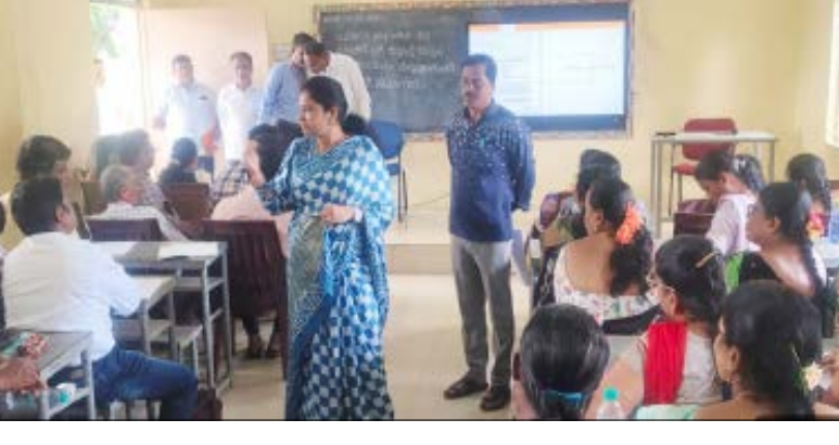
ಕರ್ನಾಟಕದಲ್ಲಿ ಕೂಡ 2002ರಲ್ಲಿ ಸಮಗ್ರ ಮತಗಟ್ಟೆ ಅಧಿಕಾರಿಗಳು ಪ್ರತಿ ಮನೆ ಮನೆಗೂ ಪರಿಷ್ಕರಣೆ ಆಗಿದ್ದು, ಈಗ 2026ರಲ್ಲಿ ಮಾಡಲಾಗುತ್ತಿದೆ. ಇದು ಭಾರತ ಚುನಾವಣಾ ಆಯೋಗದ ಮಾರ್ಗಸೂಚಿಯಂತೆ ರಾಜ್ಯ ಮುಖ್ಯ ಚುನಾವಣಾಧಿಕಾರಿಗಳು ರಾಜ್ಯದ ಎಲ್ಲ ಬೆಲ್ಟಾ ಚುನಾವಣಾಧಿಕಾರಿಗಳ ತರಬೇತಿ ನೀಡಿದ್ದು, ಅದರಂತೆ ತುಮಕೂರು ಜಿಲ್ಲೆಯಲ್ಲಿ ಕೂಡ ಈ ಪ್ರಕ್ರಿಯೆ ನಡೆಯುತ್ತಿದೆ ಎಂದು.

ಅನರ್ಹ ಹೆಸರು ಮತಪಟ್ಟಿಯಲ್ಲಿ ಸೇರಿರಬಹುದು ಎಂಬುದು ಎಸ್‌ಐಆರ್ ಪ್ರಮುಖ ಉದ್ದೇಶವಾಗಿದೆ ಎಂದು ಅವರು ಹೇಳಿದರು.