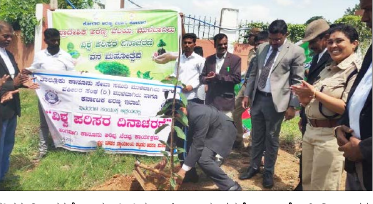
ಪರಿಸರ ದಿನಾಚರಣೆ ಅಂಗವಾಗಿ ಗಿಡ ನಾಟಿ ಕಾರ್ಯಕ್ರಮಕ್ಕೆ ಚಾಲನೆ ನೀಡಿ ಅವರು

ನಗರದ ನ್ಯಾಯಾಲಯ ಆವರಣದಲ್ಲಿ ಶುಕ್ರವಾರ ತಾಲೂಕು ಕಾನೂನು ಸೇವೆಗಳ ಸಮಿತಿ, ತಾಲೂಕು ವಕೀಲರ ಸಂಘ ಹಾಗೂ ವಲಯ ಅರಣ್ಯ ಇಲಾಖೆ ಸಂಯುಕ್ತವಾಗಿ ಗಿಡ ನಾಟಿ ಕಾರ್ಯಕ್ರಮಕ್ಕೆ ಚಾಲನೆ ನೀಡಿ ಅವರು