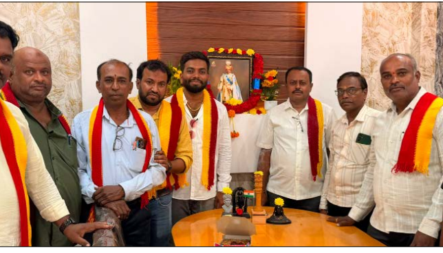
ಕಾಲೇಜುಗಳನ್ನು ಸ್ಥಾಪಿಸಿ ಮೈಸೂರು ರಾಜ್ಯವನ್ನು ವಿದ್ಯಾಪೀಠ ರಾಜ್ಯವನ್ನಾಗಿ ಪರಿವರ್ತಿಸಿದರು. ಭಾರತದಲ್ಲಿ ಮೊದಲ ಬಾರಿಗೆ ಜನಪ್ರತಿನಿಧಿ ಸಭೆಯನ್ನು ಸ್ಥಾಪಿಸಿ, ಮಹಿಳೆಯರಿಗೆ ಮತದಾನದ ಹಕ್ಕು ನೀಡಿದ ದೊರದ್ವೈಯ ರಾಜನಾಗಿದ್ದರು ಎಂದು ಹೇಳಿದರು. ಭಾರತದ ಮೊದಲ ಮೈಸೂರು ವಿಶ್ವವಿದ್ಯಾನಿಲಯ,