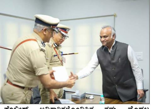
ಪೋಲೀಸ್ ಅಧಿಕಾರಿಗಳೊಂದಿಗಿನ ತಮ್ಮ ಮೊದಲ ಸಭೆಯಲ್ಲಿ ಗೃಹ ಸಚಿವ ಪ್ರಿಯಾಂಕ ಖರ್ಗೆ ಕೆಲ ಮಹತ್ವದ ವಿಚಾರಗಳನ್ನು ಹಂಚಿಕೊಂಡಿದ್ದಾರೆ. ರಾಜ್ಯದಲ್ಲಿ ಮಹಿಳಾ ಸುರಕ್ಷತೆಯ ಕುರಿತು ಹೆಚ್ಚಿನ ಆದ್ಯತೆ ನೀಡುವಂತೆ ಪೋಲೀಸ್ ಇಲಾಖೆ ಅಧಿಕಾರಿಗಳಿಗೆ ಸೂಚನೆ ನೀಡಿದ್ದಾರೆ. "ಮಹಿಳೆಯರಿಗೆ ಏನು ಧರಿಸಬೇಕೆಂದು ಹೇಳುವುದಕ್ಕಿಂತ, ಪುರುಷರಿಗೆ ಹೇಗೆ ವರ್ತಿಸಬೇಕೆನ್ನುವುದನ್ನು ತಿಳಿಸಿ ಹೇಳಬೇಕಾಗಿದೆ ಎಂದು ಅವರು ಪೋಲೀಸ್ ಅಧಿಕಾರಿಗಳಿಗೆ ಸಲಹೆಗಳನ್ನು ನೀಡಿದ್ದಾರೆ.

ಬೆಂಗಳೂರು ಡಿ.ಕೆ. ನೂತನ ಸರ್ಕಾರದ ಸಂಪುಟದಲ್ಲಿ ಗೃಹ ಸಚಿವರಾಗಿರುವ ಪ್ರಿಯಾಂಕ ಖರ್ಗೆ ಇದೇ ಮೊದಲ ಬಾರಿಗೆ ಪೋಲೀಸ್ ಇಲಾಖೆ ಹಿರಿಯ ಅಧಿಕಾರಿಗಳ ಸಭೆ ನಡೆಸಿದರು.