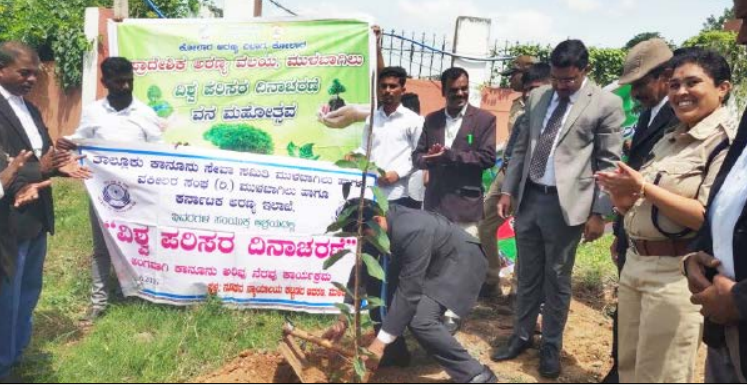
ಪರಿಸರ ದಿನಾಚರಣೆ ಅಂಗವಾಗಿ ಗಿಡ ನಾಟಿ ಕಾರ್ಯಕ್ರಮಕ್ಕೆ ಚಾಲನೆ ನೀಡಿ ಅವರು

ನಗರದ ನ್ಯಾಯಾಲಯ ಆವರಣದಲ್ಲಿ ಶುಕ್ರವಾರ ತಾಲೂಕು ಕಾನೂನು ಸೇವೆಗಳ ಸಮಿತಿ, ತಾಲೂಕು ವಕೀಲರ ಸಂಘ ಹಾಗೂ ವಲಯ ಅರಣ್ಯ ಇಲಾಖೆ ಸಂಯುಕ್ತವಾಗಿ ವಿಶ್ವ ಪರಿಸರ ದಿನಾಚರಣೆ ಅಂಗವಾಗಿ ಗಿಡ ನಾಟಿ ಕಾರ್ಯಕ್ರಮಕ್ಕೆ ಚಾಲನೆ ನೀಡಿ ಅವರು