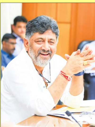
ಸಿದ್ದರಾಮಯ್ಯ ಸರ್ಕಾರದಲ್ಲಿ ಉಪಮುಖ್ಯಮಂತ್ರಿಯಾಗಿ ಅವರ ಅನುಭವ.

ಬೆಂಗಳೂರು: ಕರ್ನಾಟಕದ ಮುಂದಿನ ಮುಖ್ಯಮಂತ್ರಿಯಾಗಿ ದೊಡ್ಡದಾದ ಡಿ.ಕೆ.ಶಿವಕುಮಾರ್ ಅಧಿಕಾರ ವಹಿಸಿಕೊಳ್ಳಲಿದ್ದು, ಕಾಂಗ್ರೆಸ್ ಪಕ್ಷ ಮತ್ತು ರಾಜ್ಯ ರಾಜಕೀಯದಲ್ಲಿ ಒಂದು ಖೇಳಿಗೆ ಬದಲಾವಣೆಗೆ ನಾಂದಿ ಹಾಡಿತು. 64 ವರ್ಷದ ಒಕ್ಕಲಿಗ ನಾಯಕ ಮುಖ್ಯಮಂತ್ರಿಯಾಗುವ ಮಹತ್ವಾಕಾಂಕ್ಷಿಯನ್ನು ಬಹಳ ಹಿಂದಿನಿಂದಲೂ ಪೋಷಿಸಿಕೊಂಡಿದ್ದರು. ಅಂತಿಮವಾಗಿ, ಅವರ ಪರ ಕೆಲಸ ಮಾಡಿದ್ದು ಪಕ್ಷದ ಹೈಕಮಾಂಡ್‌ಗೆ ಅವರ ಅಚಲ ನಿಷ್ಠೆ. ಮೇ 2023 ರಲ್ಲಿ ಕಾಂಗ್ರೆಸ್ ರಾಜ್ಯದಲ್ಲಿ ತನ್ನ ಸರ್ಕಾರವನ್ನು ರಚಿಸಿದಾಗ ಶಿವಕುಮಾರ್ ಮತ್ತು ಸಿದ್ದರಾಮಯ್ಯ ನಡುವೆ ನಡೆದ ಅಧಿಕಾರ ಹಂಚಿಕೆ ಒಪ್ಪಂದದ ಸವಾಲುಗಳನ್ನು ಬಿಟ್ಟುಕೊಡದ ಹೋರಾಟ ಮಾಡಿರುವ ಡಿ.ಕೆ.ಶಿವಕುಮಾರ್ "ಟುಬಲ್-ಶೂಟ್" ಎಂದೇ ಹೆಸರುವಾಸಿಯಾಗಿದ್ದಾರೆ. ಮುಂದಿನ ಎರಡು ವರ್ಷಗಳ ಕಾಲ ಮುಖ್ಯಮಂತ್ರಿಯಾಗಿ ಅಧಿಕಾರ ವಹಿಸಿಕೊಳ್ಳಲಿದ್ದಾರೆ.