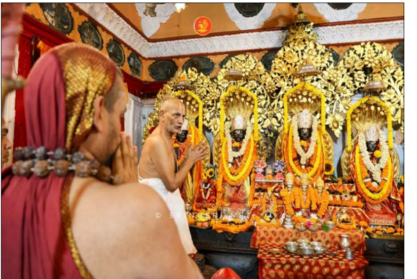
ನೇಪಾಳದ ಕಾರ್ಯಾಚರಣೆ ಶಿವ ಶಿವಶಂಕರನಾಥ ದೇವಾಲಯದ ನೈಋತ್ಯಕ್ಕೆ ಒಂದು ಶಿಲಾ ಮೂರ್ತಿ ದೊರಕಿದುದು ಬಹುಕಾಲದಿಂದಲೂ ಶ್ರೀಗೌರಿ ಜಗದ್ಗುರು ಶಿವ ಶಿವ ಶಿವಶಂಕರನಾಥ ದೇವಾಲಯದ ಸಮೀಪದಲ್ಲಿ ಭೇಟಿ ನೀಡಿ ದೇವರ ದರ್ಶನ ಪಡೆದರು.

ಬ್ಯಾಂಕ್ ವಿವರ ಹಂಚಿಕೆ ಹಾಗೂ ಆನ್‌ಲೈನ್ ವಂಚನೆಗಳ ಬಗ್ಗೆ ಎಚ್ಚರಿಕೆಯಿಂದ ಇರಬೇಕೆಂದು ಸಲಹೆ ನೀಡಲಾಯಿತು. ಸಭೆಯ ಅಂತ್ಯದಲ್ಲಿ ಹಿರಿಯ ನಾಗರಿಕರು ಪೊಲೀಸ್ ಇಲಾಖೆಯ ಜನಸ್ನೇಹಿ ಕಾರ್ಯವನ್ನು ಶ್ಲಾಘಿಸಿ, ಇಂತಹ ಕಾರ್ಯಕ್ರಮಗಳು ಗ್ರಾಮೀಣ ಜನರಿಗೆ ಧೈರ್ಯ ತುಂಬುತ್ತವೆ ಎಂದು ಮೆಚ್ಚುಗೆ ವ್ಯಕ್ತಪಡಿಸಿದರು.