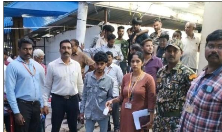
ದಾಖಲಿಸಿ, ಉಲ್ಲಂಘನೆದಾರರಿಗೆ ರೂ.88,200 ದಂಡ ವಿಧಿಸಲಾಗಿದೆ ಎಂದು ಆಯುಕ್ತರು ತಿಳಿಸಿದ್ದಾರೆ. ಸಾರ್ವಜನಿಕ ಸುಗಮ ಸಂಚಾರಕ್ಕೆ ಅಡ್ಡಿಯಾಗುವಂತಹ ಯಾವುದೇ ರೀತಿಯ ಒತ್ತುವರಿಯನ್ನು ಸಹಿಸಲಾಗುವುದಿಲ್ಲವೆಂದು ಸ್ಪಷ್ಟ ಸಂದೇಶವನ್ನು ನೀಡಿರುವ ಪಾಲಿಕೆ, ಎಲ್ಲಾ ಅಂಗಡಿ ಮಾಲೀಕರಿಗೂ ಎಚ್ಚರಿಕೆ ನೀಡಿದೆ. ಸಂಪೂರ್ಣವಾಗಿ ಒತ್ತುವರಿ ತೆರವುಗೊಳಿಸುವವರೆಗೆ ಈ ವಿಶೇಷ ಕಾರ್ಯಾಚರಣೆ ಮುಂದುವರಿಯಲಿದೆ ಎಂದು ಅಧಿಕಾರಿಗಳು ತಿಳಿಸಿದ್ದಾರೆ. ಮುಂದಿನ ದಿನಗಳಲ್ಲಿಯೂ ಒತ್ತುವರಿ ಮುಂದುವರೆದರೆ, ಸಾರ್ವಜನಿಕ ಹಿತದೃಷ್ಟಿಯಿಂದ ಕಠಿಣ ಕಾನೂನು ಕ್ರಮಗಳೊಂದಿಗೆ ವಾಣಿಜ್ಯ ಪರವಾನಿಗೆ ರದ್ದುಪಡಿಸುವಂತಹ ಕ್ರಮಗಳನ್ನು ಕೈಗೊಳ್ಳಲಾಗುವುದು ಎಂದು ಆಯುಕ್ತ ಕೆ.ಎನ್. ರಮೇಶ್ ಎಚ್ಚರಿಕೆ ನೀಡಿದ್ದಾರೆ.

ಬೆಂಗಳೂರು ದಕ್ಷಿಣ ನಗರ ಪಾಲಿಕೆ ವ್ಯಾಪ್ತಿಗೆ ಒಳಪಟ್ಟ ಜಯನಗರ ವಾಣಿಜ್ಯ ಸಂಕೀರ್ಣದಲ್ಲಿ ಒತ್ತುವರಿ ತೆರವು ಕಾರ್ಯಾಚರಣೆ ನಡೆಸಲಾಗಿದ್ದು, ಒಟ್ಟು 88,200 ದಂಡ ವಸೂಲಿ ಮಾಡಲಾಗಿದೆ ಎಂದು ಆಯುಕ್ತ ಕೆ.ಎನ್. ರಮೇಶ್ ತಿಳಿಸಿದ್ದಾರೆ. ಸುಮಾರು 15,000 ಚದರ ಅಡಿ ವಿಸ್ತೀರ್ಣ ಹೊಂದಿರುವ ಈ ಸಂಕೀರ್ಣದಲ್ಲಿ 270ಕ್ಕೂ ಹೆಚ್ಚು ಅಂಗಡಿಗಳು ಕಾರ್ಯನಿರ್ವಹಿಸುತ್ತಿದ್ದು, ಕಾರಿಡಾರ್‌ಗಳು, ಪಾದಚಾರಿ ಮಾರ್ಗಗಳು ಮತ್ತು ಸಾರ್ವಜನಿಕ ಸ್ಥಳಗಳನ್ನು ಅಂಗಡಿ ಮಾಲೀಕರು ಹಾಗೂ ವ್ಯಾಪಾರಿಗಳು ಅತಿಕ್ರಮಿಸಿಕೊಂಡಿರುವ ಬಗ್ಗೆ ಸಾರ್ವಜನಿಕರಿಂದ ಹಲವು ದೂರುಗಳು ಬಂದಿದ್ದವು. ಈ ಹಿನ್ನೆಲೆಯಲ್ಲಿ ಕಳೆದ ಮೂರು ದಿನಗಳಿಂದ ಪಾಲಿಕೆ ಅಧಿಕಾರಿಗಳು ಅಂಗಡಿ ಮಾಲೀಕರಿಗೆ ತಮ್ಮ ವ್ಯಾಪ್ತಿಯನ್ನು ಮೇಲಿಂದ ಅನಧಿಕೃತ ಒತ್ತುವರಿಯನ್ನು ಸ್ವಯಂಪ್ರೇರಿತವಾಗಿ ತೆರವುಗೊಳಿಸುವಂತೆ ಜಾಗೃತಿ ಮೂಡಿಸಿದ್ದರು. ಆದಾಗ್ಯೂ, ಸೂಚನೆಗಳ ನಂತರವೂ ಒತ್ತುವರಿ ಮುಂದುವರೆದ ಹಿನ್ನೆಲೆಯಲ್ಲಿ ಪಾಲಿಕೆಯಿಂದ ಕಠಿಣ ಕ್ರಮ ಕೈಗೊಳ್ಳಲಾಗಿದೆ. ಕಾರಿಡಾರ್ ಮತ್ತು ಪಾದಚಾರಿ ಮಾರ್ಗಗಳನ್ನು ಅತಿಕ್ರಮಿಸಿರುವ ಹಿನ್ನೆಲೆಯಲ್ಲಿ ಒಟ್ಟು 39 ಪ್ರಕರಣಗಳನ್ನು