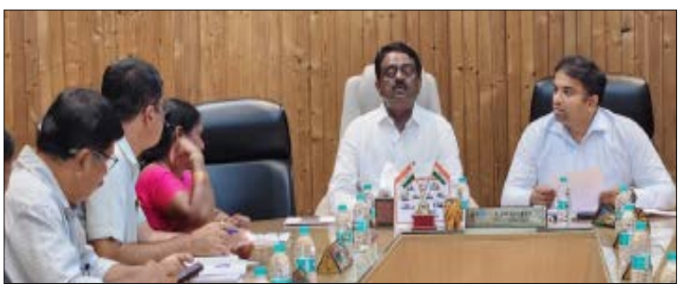
ಸ್ಥಳಗಳನ್ನು ಗುರುತಿಸಿ ಸಿಗ್ನಲ್ ವ್ಯವಸ್ಥೆಯನ್ನು ಸುಧಾರಿಸುವುದು, ಟೋಯಿಂಗ್ ವಾಹನಗಳ ಕಾರ್ಯಾಚರಣೆಯನ್ನು ಪರಿಣಾಮಕಾರಿಯಾಗಿ ನಡೆಸುವುದು ಹಾಗೂ ಕಸದ ಸಮಸ್ಯೆ ನಿರ್ವಹಣೆಗೆ ಹೆಚ್ಚಿನ ಆದ್ಯತೆ ನೀಡುವಂತೆ ಆಯುಕ್ತರು ತಿಳಿಸಿದರು. ವಿದ್ಯುತ್ ದೀಪಗಳ ನಿರ್ವಹಣೆ, ಪಾರ್ಕ್‌ಗಳ ಸಂರಕ್ಷಣೆ, ಕುಡಿಯುವ ನೀರು ಮತ್ತು ಶೌಚಾಲಯ ಸೌಲಭ್ಯಗಳ ಸುಧಾರಣೆಗೂ ಗಮನ ಹರಿಸಲು ಸೂಚಿಸಲಾಯಿತು. ಅನಧಿಕೃತ ಫ್ಲೆಕ್ಸ್ ಹಾಗೂ ಬ್ಯಾನರ್‌ಗಳನ್ನು ತೆರವುಗೊಳಿಸುವುದು, ಪಾದಚಾರಿ ಮಾರ್ಗಗಳ ಮೇಲಿನ ಅನಧಿಕೃತ ಮಳಿಗೆಗಳನ್ನು ತೆರವುಗೊಳಿಸುವುದು ಹಾಗೂ ಹೊಸ ಅಪಾರ್ಟ್‌ಮೆಂಟ್ ಪ್ರದೇಶಗಳಲ್ಲಿ ಇ-ವಾತಾ ಮೇಳಗಳನ್ನು ಆಯೋಜಿಸುವ ಬಗ್ಗೆ ನಿರ್ದೇಶನ ನೀಡಲಾಯಿತು. ಮಳೆಗಾಲದ ಮುಂಜಾಗೃತಾ ಕ್ರಮಗಳನ್ನು ಕೈಗೊಳ್ಳಲು ಹಾಗೂ ಯಾವುದೇ ಅವಂತರಗಳು ಸಂಭವಿಸದಂತೆ ಮುನ್ನೆಚ್ಚರಿಕೆ ಕ್ರಮಗಳನ್ನು ಅನುಸರಿಸಲು ಸೂಚಿಸಲಾಯಿತು. ಚೊಕ್ಕಸಂದ್ರ ಕೆಲವು ಅಭಿವೃದ್ಧಿಗೆ ಆದ್ಯತೆ