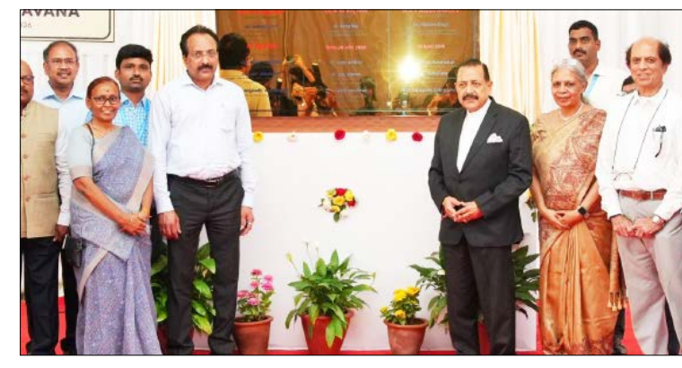
ಇದು ಮಹತ್ವದ ಹೆಜ್ಜೆಯಾಗಿದೆ ಎಂದು ಸಚಿವರು ಹೇಳಿದರು. ಸಚಿವರು ಮಾತನಾಡುತ್ತಾ, ಬಾಹ್ಯಾಕಾಶ, ರಕ್ಷಣಾ ಹಾಗೂ ಅಂತರರಾಷ್ಟ್ರೀಯ ವಲಯಗಳಲ್ಲಿ ಬಳಕೆಯಾಗುತ್ತಿರುವ ಸುಧಾರಿತ ಖಗೋಳ ಉಪಕರಣಗಳಲ್ಲಿ ಭಾರತದ ಸ್ಥಳೀಯ ತಂತ್ರಜ್ಞಾನ ಸಾಮರ್ಥ್ಯವನ್ನು ಸಂಪೂರ್ಣವಾಗಿ ಬಳಸಿಕೊಳ್ಳಲಾಗುತ್ತಿದೆ ಎಂದು ತಿಳಿಸಿದರು. ಐ.ಐ.ಎ.ಯಲ್ಲಿ ಅಭಿವೃದ್ಧಿಪಡಿಸಲಾದ ತಂತ್ರಜ್ಞಾನಗಳನ್ನು ಇನ್ನೂ ಸೇರಿದಂತೆ ಹಲವು ರಾಷ್ಟ್ರೀಯ ಮತ್ತು ಅಂತರರಾಷ್ಟ್ರೀಯ ಬಾಹ್ಯಾಕಾಶ ಕಾರ್ಯಾಚರಣೆಗಳಲ್ಲಿ ಬಳಸಲಾಗುತ್ತಿದೆ ಎಂದು

ಬೆಂಗಳೂರು ಭಾರತೀಯ ಖಗೋಳ ಭೌತಶಾಸ್ತ್ರ ಸಂಸ್ಥೆ (ಐ.ಐ.ಎ.)ಯಲ್ಲಿ 75 ಕೋಟಿ ವೆಚ್ಚದ ಅತ್ಯಾಧುನಿಕ ಹೊಸ ಹೆಚ್ಚುವರಿ ಕಟ್ಟಡಕ್ಕೆ ಕೇಂದ್ರ ಸಚಿವರಾದ ಡಾ. ಚತೇಂದ್ರ ಸಿಂಗ್ ಶಂಕುಸ್ಥಾಪನೆ ನೆರವೇರಿಸಿದರು. ಕೋರಮಂಜಿಲ್ಲದಲ್ಲಿರುವ ಸಂಸ್ಥೆಯ ಆವರಣದಲ್ಲಿ ನಡೆದ ಈ ಕಾರ್ಯಕ್ರಮದಲ್ಲಿ ವಿಜ್ಞಾನಿಗಳು, ಸಂಶೋಧಕರು ಹಾಗೂ ವಿವಿಧ ಇಲಾಖೆಗಳ ಅಧಿಕಾರಿಗಳು ಉಪಸ್ಥಿತರಿದ್ದರು. ಈ ಸೂತನ ಕಟ್ಟಡವು ಏಳು ಅಂತಸ್ತಿನದಾಗಿದ್ದು, ಸುಮಾರು ಒಂದು ಲಕ್ಷ ಚದರ ಅಡಿ ವಿಸ್ತೀರ್ಣದಲ್ಲಿ ನಿರ್ಮಾಣವಾಗಲಿದೆ. ದೇಶದ ಪ್ರಮುಖ ವೈಜ್ಞಾನಿಕ ಕೇಂದ್ರಗಳಲ್ಲಿ ಒಂದಾಗಿ ಇದನ್ನು ಅಭಿವೃದ್ಧಿಪಡಿಸಲಾಗುತ್ತಿದ್ದು, ಖಗೋಳಶಾಸ್ತ್ರ ಮತ್ತು ಖಗೋಳ ಭೌತಶಾಸ್ತ್ರ ಕ್ಷೇತ್ರದಲ್ಲಿ ಭಾರತದ ಸಾಮರ್ಥ್ಯವನ್ನು ಮತ್ತಷ್ಟು ಬಲಪಡಿಸುವ ಉದ್ದೇಶ ಹೊಂದಿದೆ. ವಿಶ್ವ ದರ್ಜೆಯ, ಭವಿಷ್ಯಮುಖ ಸಂಶೋಧನೆಗಳಿಗೆ