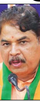
ಸ್ವೀಕಾರ ಸಾಧ್ಯವೇ ? ಎಂದು ಆಶ್ಚರ್ಯ ವ್ಯಕ್ತಪಡಿಸಿದ್ದಾರೆ. ಎರಡನೆಯದಾಗಿ, ಕೇಂದ್ರ ಸರ್ಕಾರ ಈಗಾಗಲೇ ದಶವಾರ್ಷಿಕ ಜನಗಣತಿಯಲ್ಲಿ ದೇಶವ್ಯಾಪಿ ಜಾತಿ ಜನಗಣತಿ ನಡೆಸುವುದಾಗಿ ಘೋಷಿಸಿದ್ದು, ಅದರ ಪ್ರಕ್ರಿಯೆಯೂ ಆರಂಭವಾಗಿದೆ. ಆದರೂ ತಮ ಸ್ವಾರ್ಥ ರಾಜಕಾರಣಕ್ಕಾಗಿ ಕನ್ನಡಿಗರ ತೆರಿಗೆ ಹಣವನ್ನು ಮಾಡಿ, ತಲಾತುರಿಯಲ್ಲಿ ವರದಿ ಸ್ವೀಕರಿಸಿ ಅದನ್ನು ಸೋರಿಕೆ ಮಾಡುವ ಮೂಲಕ ಸಮಾಜದಲ್ಲಿ ಅನಿರೀಕ್ಷಿಸಬಹುದಾದ ಅಪಾಯಕಾರಿ ರಾಜಕಾರಣಕ್ಕೆ ಕೈ ಹಾಕಿದ್ದಾರೆ ಎಂದು ವಾಗ್ದಾಳಿ ನಡೆಸಿದ್ದಾರೆ. ರಾಜೀನಾಮೆ ಕೊಡುವ ಹೊಸ್ತಿಲಲ್ಲೂ ತಮ ಓಗ ಪ್ರತಿಷ್ಠೆ ಮತ್ತು ಸ್ವತಂತ್ರತೆಗೆ ಬಿಡದ ಸಿದ್ದರಾಮಯ್ಯನವರ ಸನ್ನಿಹಿತ ಹಾಗೂ ಕೆಳ ಮಟ್ಟದ ರಾಜಕಾರಣ ಕರ್ನಾಟಕದ ರಾಜಕೀಯ ಇತಿಹಾಸದಲ್ಲಿ ಕಷ್ಟಪಟ್ಟುಕೊಂಡು ಉಳಿಯುವುದರಲ್ಲಿ ಯಾವುದೇ ಸಂದೇಹವಿಲ್ಲ ಎಂದು ಆಶೋಕ್ ಎಚ್ಚರಿಸಿದ್ದಾರೆ.

ಆಲೆ ಇದೆ. ಹೈಕಮಾಂಡ್ ಬಳಿ ಭೀಮಾರಿ ಹಾಕಿಸಿಕೊಂಡು ಒಲ್ಲದ ಮನಸ್ಸಿನಿಂದ ರಾಜೀನಾಮೆ ಕಡೆಗೆ ಸಾಗುತ್ತಿರುವ ಸಿದ್ದರಾಮಯ್ಯನವರು, ಕನಿಷ್ಠ ಈಗಲಾದರೂ ತಮ ತುಷ್ಟಿಕರಣ ರಾಜಕಾರಣ ಮತ್ತು ಫೋರಂಗಿ ಸಮಾಜವಾದದ ಬಗ್ಗೆ ಆತಾವಲೋಕನ ಮಾಡಿಕೊಳ್ಳುತ್ತಾರೆ, ಪಶ್ಚಾತ್ತಾಪ ಪಡುತ್ತಾರೆ ಎಂದು ಭಾವಿಸಿದ್ದೆ. ಆದರೆ ಕುಟುಂಬ ಬಿಡುವ ಕೊನೆಯ ಕ್ಷಣದಲ್ಲೂ ಕೂಡ ಓಲೈಕೆ ರಾಜಕಾರಣ ಮುಂದುವರಿಸಿ ತಮ ಭಂಡತನವನ್ನು ಮತ್ತೊಮ್ಮೆ ಪ್ರದರ್ಶಿಸಿದ್ದಾರೆ ಎಂದು ಕಿಡಿಹಾಕಿದ್ದಾರೆ. ಮೊದಲನೆಯದಾಗಿ, ಇಷ್ಟು ದೊಡ್ಡ ಪ್ರಮಾಣದ ದತ್ತಾಂಶವನ್ನು ಕೇವಲ ಕೆಲ ಗಂಟೆಗಳಲ್ಲಿ ಸಂಸ್ಕರಿಸಿ ಅಂತಿಮ ವರದಿ ರೂಪಿಸುವುದು ಅಸಾಧ್ಯ. ಇದಕ್ಕಾಗಿಯೇ ದೆಹಲಿ ಭೇಟಿಯಲ್ಲಿ ಹೈಕಮಾಂಡ್ ಮುಂದೆ ಸ್ವತಃ ಮುಖ್ಯಮಂತ್ರಿಗಳೇ 15 ದಿನಗಳ ಕಾಲಾವಕಾಶ ಕೇಳಿದ್ದಾರೆ ಎಂಬ ಸುದ್ದಿಗಳಿದ್ದವು. ಹಾಗಿದ್ದಾಗ ಕೇವಲ 24 ಗಂಟೆಗಳಲ್ಲಿ ವರದಿ