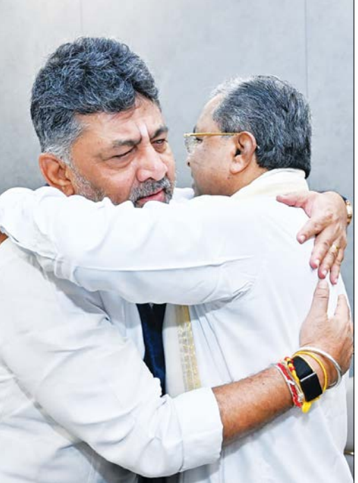
ಮುಖ್ಯಮಂತ್ರಿಗಳಿಗೆ ಅವಕಾಶ ಮಾಡಿಕೊಡುವುದು ಅವರ ಕರ್ತವ್ಯ ಎಂದು. ಇದೇ ವೇಳೆ ನಮ್ಮ ಪಕ್ಷ 135 ಮತ್ತು 1 ಸ್ಥಾನಗಳನ್ನು ನಾವು ಪಡೆದಿದ್ದೇವೆ. ಜೊತೆಯಲ್ಲಿ ಇಬ್ಬರು ಸ್ವತಂತ್ರ ಅಭ್ಯರ್ಥಿಗಳೂ ಕೂಡ ಬೆಂಬಲ ಘೋಷಿಸಿದ್ದಾರೆ. ಓಗಾಗಿ ನಾವು ಸಂಪೂರ್ಣ ಬಹುಮತದಲ್ಲಿದ್ದೇವೆ. ಓಗಾಗಿ ಮುಂದಿನ ಮುಖ್ಯಮಂತ್ರಿಗೆ ಅವಕಾಶ ನೀಡಬೇಕು. ಸಂವಿಧಾನ ಬದ್ಧವಾಗಿ ನಡೆದುಕೊಳ್ಳಬೇಕು ಎಂದು ಮುಖ್ಯಮಂತ್ರಿ ಅವರು ಹೇಳಿದರು. ಇದೇ ವೇಳೆ ದಿವಂಗತ ನಟ ಡಾ.ರಾಜ್

ಬೆಂಗಳೂರು: ಮುಖ್ಯಮಂತ್ರಿ ಸ್ಥಾನಕ್ಕೆ ತಾವು ರಾಜೀನಾಮೆ ನೀಡಿರುವುದಾಗಿ ಸಿದ್ದರಾಮಯ್ಯ ಅವರು ಗುರುವಾರ ಅಧಿಕೃತವಾಗಿ ಪ್ರಕಟಿಸಿದ್ದಾರೆ. ಸುದ್ದಿಗೋಷ್ಠಿಯನ್ನು ದೇಶೀ ಮಾತೆ ನಾಡಿನ ಸಿದ್ದರಾಮಯ್ಯ, ತಮ್ಮ ಮುಖ್ಯ ಮಂತ್ರಿ ಸ್ಥಾನಕ್ಕೆ ರಾಜೀನಾಮೆ ನೀಡಿದ್ದಾಗಿ ಹೇಳಿದರು. ಆದರೆ ರಾಜ್ಯಪಾಲರು ಬೆಂಗಳೂರಿನಲ್ಲಿ ಇಲ್ಲದ ಕಾರಣ, ರಾಜೀನಾಮೆ ಪತ್ರವನ್ನು ಅವರ ಕಚೇರಿಯ ಕಾರ್ಯದರ್ಶಿ ಹಸ್ತಾಂತರಿಸಲಾಗಿದೆ ಎಂದು ತಿಳಿಸಿದರು. ರಾಜೀನಾಮೆ ನೀಡಿದ ನಂತರ ಗೃಹ ಕಚೇರಿ ಕೃಷ್ಣಾದಲ್ಲಿ ನಡೆದ ಪತ್ರಿಕಾಗೋಷ್ಠಿಯಲ್ಲಿ ಮಾತೆ ನಾಡಿನ ಸಿದ್ದರಾಮಯ್ಯ, ತಾವು ಯಾವಾಗಲೂ ಹೈಕಮಾಂಡ್ ತೀರ್ಮಾನಕ್ಕೆ ಬದ್ಧರಾಗಿದ್ದು, ನಾಯಕರು ಸೂಚಿಸಿದಂತೆ ಗುರುವಾರವೇ ರಾಜೀನಾಮೆ ಸಲ್ಲಿಸಿರುವುದಾಗಿ ಸ್ಪಷ್ಟಪಡಿಸಿದರು. "ಹೈಕಮಾಂಡ್ ಯಾವಾಗ ಸೂಚಿಸುತ್ತಾರೋ ಆಗ ರಾಜೀನಾಮೆ ನೀಡುತ್ತೇನೆ ಎಂದು ಹೇಳಿದ್ದೆ. ಆದರೆ ಪ್ರಕಾರ ಮೊನ್ನೆ ಹೈಕಮಾಂಡ್ ರಾಜೀನಾಮೆ ನೀಡಿ ಎಂದು ಹೇಳಿದರು. ಓಗಾಗಿ ನಾನು ನಾಡಿದ್ದು ರಾಜೀನಾಮೆ ನೀಡುತ್ತೇನೆ ಎಂದು ಹೇಳಿದ್ದೆ. ಇಂದು ನನ್ನ ರಾಜೀನಾಮೆ ನೀಡಿದ್ದೇನೆ. ರಾಜ್ಯಪಾಲರು ನನ್ನ ರಾಜೀನಾಮೆ ಪತ್ರವನ್ನು ಅವರು ಆಗಮಿಸಿದ ಬಳಿಕ ಅಂಗೀಕಾರ ಮಾಡುತ್ತಾರೆ ಎಂಬ ಸಂಪೂರ್ಣ ವಿಶ್ವಾಸವಿದೆ. ಅಲ್ಲದೆ ಸಂವಿಧಾನದ ಪ್ರಕಾರ ಮಾಡಲೇಬೇಕು ಕೂಡ. ಒಂದು ಸಾರಿ ಮುಖ್ಯಮಂತ್ರಿಗಳು ರಾಜೀನಾಮೆ ಕೊಟ್ಟ ಮೇಲೆ ಅಂಗೀಕಾರ ಮಾಡಿ, ಮುಂದಿನ