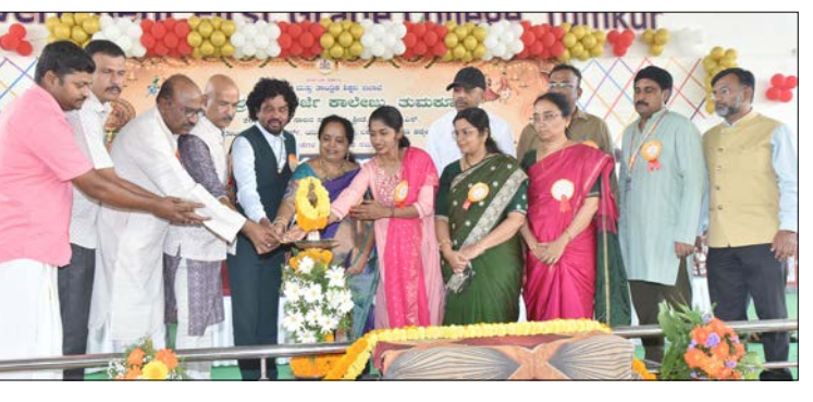
ಚಿನ್ನದ ಪದಕ ಪಡೆದ, ಸೂಕ್ತ ಮಾರ್ಗದರ್ಶನ ಮತ್ತು ಪ್ರೋತ್ಸಾಹದೊಂದಿಗೆ ದೊರಕಿದ ಸಾಧನೆಯನ್ನು ಮೆಚ್ಚಿನಂತೆ, ಸಾಧನೆಯ ಕಡೆಗೆ ಹೆಜ್ಜೆ ಹಾಕಲು ಸೂಕ್ತ ದೊರೆಯುತ್ತದೆ. ಸೋಲಿಸುವುದೇ ಸಂಭ್ರಮವಲ್ಲ. ಗೆದ್ದವರನ್ನು ಸೋಲಿಸುವುದು ನಿಜವಾದ ಸಂಭ್ರಮ. ಪ್ರೋತ್ಸಾಹಕರ ಕಣ್ಣಲ್ಲಿ ಆನಂದ ಭಾಷ್ಯ ಬರುವಂತೆ ಮಾಡುವುದೇ ನಮ್ಮ ಗುರಿಯಾಗಬೇಕು ಎಂದರು. ಶಾಲಾ ಕಾಲೇಜು ದಿನಗಳಲ್ಲಿ ಹಾಡುಗಾರನಾಗಿ, ರಂಗೋಲಿ ಕಲೆಗಾರನಾಗಿ ಎಲ್ಲೆಡೆ ಸ್ಪರ್ಧೆ ಮಾಡುತ್ತಿದ್ದೆ. ಇದನ್ನು ಗುರುತಿಸಿದ ಬಿಂಬಿಯ ನನ್ನ ಬೆನ್ನು ತಟ್ಟಿದರು. ಇದರ ಭಾಗವಾಗಿ ಜಾನಪದ ಹಾಡುಗಾರಿಕೆಯಲ್ಲಿ ಚಿನ್ನಪದಕ ಪಡೆಯುವುದರ ಜೊತೆಗೆ, 9 ವಿವಿಧ ಶಿಕ್ಷಣ ಹಾಡುಗಾರಿಕೆ ಮಾಡಲು ಅವಕಾಶ ದೊರೆಯಿತು. ಇದಕ್ಕೆ ವೇದಿಕೆ