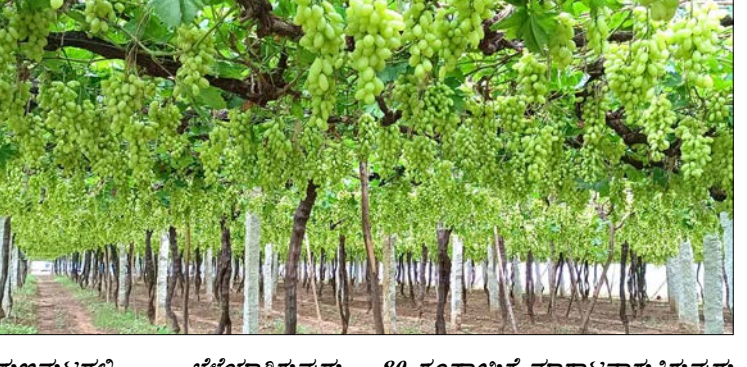
ಗುಣಮಟ್ಟದಲ್ಲಿ ಬೆಳೆಯಾಗಿರುವುದು, ದೋಣಿಗಳು ನಿಯಂತ್ರಣದಲ್ಲಿರುವುದು, ಮತ್ತು ಬೇಸಿಗೆಯಲ್ಲಿ ಬಿಸಿಲಿನ ತಾಪಮಾನದಿಂದಾಗಿ ತೋಟಗಳಲ್ಲಿ ಬೆಳೆ ಕಟ್ಟದಿದ್ದ ಕಾರಣದಿಂದಲೂ ದ್ರಾಕ್ಷೆಗೆ ಹೆಚ್ಚಿನ ಬೇಡಿಕೆ ಬಂದಿದೆ. ಬೆಂಗಳೂರು ಗ್ರಾಮಾಂತರ ಜಿಲ್ಲೆಯಲ್ಲಿ ಹೆಚ್ಚಾಗಿ ಬೆಳೆಯುವಂತಹ ಬೆಂಗಳೂರು ಬ್ಲಾಕ್ ದ್ರಾಕ್ಷೆ ಕೆ.ಜಿ.45 ರೂಪಾಯಿ, ದಿಲ್ ಕುಶ್ 50, ರೆಡ್ ಗ್ಲೋಬ್ 120, ಶರತ್

ಬಿಜಯಪುರ ರಾಜ್ಯಾದ್ಯಂತ ಹೆಚ್ಚಿನ ಮಾದುಕಟ್ಟೆಯಲ್ಲಿ ತರಹವಾಗಿ ಮಾವಿನ ಫಲವು ಕಾಣಿಸಿದೆ. ಮಾದುಕಟ್ಟೆಗಳಲ್ಲಿ ಮಾವು ವಿನ್ಯಾಸಗೊಂಡಿರುವುದರ ಪ್ರಮೋಟಿಯ ನಡವಳಿಯೂ, ಗ್ರಾಮೀಣ ಭಾಗದಲ್ಲಿ, ರೈತರು ಬೇಕೆಂದಿರುವ ವಿವಿಧ ತಳಿಯ ದ್ರಾಕ್ಷೆ ಬೆಳೆ ಬೆಲೆ ಸುಧಾರಣೆಯಲ್ಲಿರುವುದು ರೈತಾಪಿ ವರ್ಗದಲ್ಲಿ ನಿರೀಕ್ಷೆ ಮೂಡಿಸಿದೆ. ಸಹಜವಾಗಿ, ಬೇಸಿಗೆಯಲ್ಲಿ ಆರಂಭವಾಗುವ ಮಾವಿನ ಸೀಜನ್ ನಲ್ಲಿ, ದ್ರಾಕ್ಷೆಗೆ ಬೇಡಿಕೆ ಕುಸಿಯುತ್ತದೆ. ಇದರಿಂದ ದ್ರಾಕ್ಷೆ ಬೆಳೆಗಾರರು ವ್ಯಾಪಾರಿಗಳ ಬಳಿಗೆ ಹೋಗಿ, ಅಂಗಲಾಚಿಕೊಂಡು, ಬೆಳೆ ಖರೀದಿಸುವಂತೆ ದುಂಬಾಲು ಬೀಳಬೇಕಾಗಿತ್ತು. ಆದರೆ, ಈ ಬಾರಿ, ದ್ರಾಕ್ಷೆ ಬೆಳೆಗಾರರಿಗೆ ಅಂತಹ ಹೊಡೆತ ಬಿಟ್ಟಿಲ್ಲವೆಂದು ಕೊಂಡ ಸಮಾಧಾನ ತರಿಸಿದೆ. ಈ ಬಾರಿ ಕಡಿಮೆ ಪ್ರಮಾಣದಲ್ಲಿ ಉತ್ಪಾದನೆ