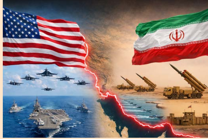
ಹದಗುಗಳಿಗೆ ಅಪಾಯ ಉಂಟುಮಾಡುವ

ಟೆಹ್ರಾನ್: ಹಾರ್ಮುಜ್ ಜಲಸಂಧಿಯಲ್ಲಿ ಅಮೆರಿಕ ಮತ್ತು ಇರಾನ್ ನಡವಳಿ. ಇರಾನ್ ಮಿಲಿಟರಿ ತಾಣವನ್ನು ಗುರಿಯಾಗಿಸಿಕೊಂಡು ಅಮೆರಿಕ ಸೇನೆಯು ರಾತ್ರಿಯಿಡೀ ದಾಳಿ ನಡೆಸಿದೆ. ಈ ವೇಳೆ ಇರಾನ್ ಕೂಡ ಪ್ರತಿದಾಳಿ ಮಾಡಿದ್ದು, ಇರಾನಿನ ಡ್ರೋನ್‌ಗಳನ್ನು ಅಮೆರಿಕ ಹೊಡೆದುರುಳಿಸಿದೆ ಎಂದು ಅಮೆರಿಕ ಅಧಿಕಾರಿಯೊಬ್ಬರು ತಿಳಿಸಿದ್ದಾರೆ. ಬಂದರ್ ಅಬ್ಬಾಸ್ ಬಳಿ ದಾಳಿಯ ಬಳಿಕ ಇರಾನ್ ಅಮೆರಿಕದ ಸೇನಾ ನೆಲೆ ಮೇಲೆ ಪ್ರತಿಕಾರದ ದಾಳಿ ನಡೆಸಿದೆ. ಅಮೆರಿಕದ ದಾಳಿಗೆ ಪ್ರತಿಕಾರವಾಗಿ ಇರಾನ್ ಇಸ್ಲಾಮಿಕ್ ರೆವಲ್ಯೂಷನರಿ ಗಾರ್ಡ್ಸ್ ಕಾರ್ಪ್ಸ್ ಇಂದು ಗುರುವಾರ ಅಮೆರಿಕದ ನೆಲೆಯನ್ನು ಗುರಿಯಾಗಿಸಿಕೊಂಡು ದಾಳಿ ನಡೆಸಿದೆ. ಬಂದರ್ ಅಬ್ಬಾಸ್ ವಿಮಾನ ನಿಲ್ದಾಣದ ಹೊರವಲಯದಲ್ಲಿರುವ ಸ್ಥಳದ ಮೇಲೆ ಇಂದು ಬೆಳಿಗ್ಗೆ ಅಮೆರಿಕ ಸೇನೆ ನಡೆಸಿದ ದಾಳಿ ಬಳಿಕ ಈ ದಾಳಿ ನಡೆದಿದೆ. ಹಾರ್ಮುಜ್ ಜಲಸಂಧಿಗೆ ಬೆದರಿಕೆ ಒಡ್ಡಲು ಯತ್ನಿಸುತ್ತಿದ್ದ ಇರಾನಿನ 4 ಡ್ರೋನ್‌ಗಳನ್ನು ಅಮೆರಿಕ ಹೊಡೆದುರುಳಿಸಿದೆ. ಅಮೆರಿಕದ ರಕ್ಷಣಾ ಇಲಾಖೆ ಮೂಲಗಳ ಪ್ರಕಾರ, ಹಾರ್ಮುಜ್ ಜಲಸಂಧಿ ಸುತ್ತಮುತ್ತ ಅಮೆರಿಕ ಮತ್ತು ಮೈತ್ರಿ ರಾಷ್ಟ್ರಗಳ