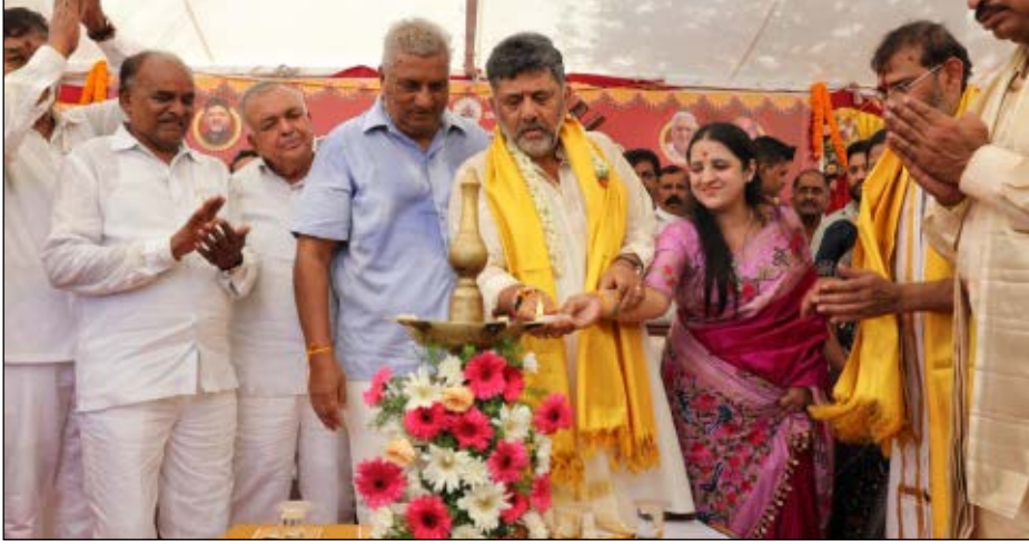
ಜಾಮರಾಜನಗರ ದೇವರ ನಾಡು ದೇವರ ನಾಡು. ಜಾಮರಾಜೇಶ್ವರ, ಬಿಳಿಗಿರಿ ರಂಗನಾಥ, “ಜಾಮರಾಜನಗರ ಒಂದುಳಿದ ಜಿಲ್ಲೆಯಲ್ಲ. ಇದು ಒಂದುವರ್ ಗೋಪಾಲಸ್ವಾಮಿ, ಮಲೆ ಮಾದೇಶ್ವರ.

ಜಾಮರಾಜನಗರ “ದೇವರು ಕಷ್ಟಕೊಡುತ್ತಾನೆ ಜೊತೆಗೆ ಅದನ್ನು ಎದುರಿಸುವ ಶಕ್ತಿಯನ್ನೂ ನೀಡುತ್ತಾನೆ. ದಾರಿ ತೋರಿಸುವುದು ದೇವರ ಕೆಲಸ, ಗುರಿ ತಲುಪಬೇಕಿರುವುದು ನಮ್ಮ ಕೆಲಸ. ದೇವರು ನೀಡುವ ಅವಕಾಶವನ್ನು ಬಳಸಿಕೊಳ್ಳಬೇಕು. ಅವಕಾಶ ಸಿಕ್ಕಾಗ ಕೈಯಿಂದ ದಾನ ಮಾಡಿ” ಎಂದು ಡಿಸಿಎಂ ಡಿ.ಕೆ. ಶಿವಕುಮಾರ್ ಅವರು ತಿಳಿಸಿದರು.