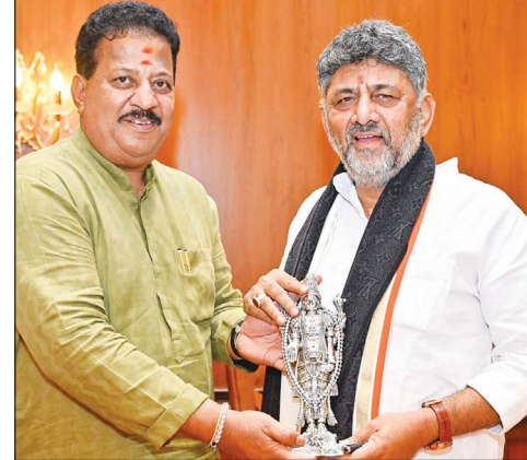
ಯಲಹಂಕ ಶಾಸಕ ಎನ್ ಆರ್ ಶಿವಕುಮಾರ್ ಅವರು ನೂತನ ಮುಖ್ಯಮಂತ್ರಿ ಡಿ ಕೆ ಶಿವಕುಮಾರ್ ಅವರನ್ನು ಭೇಟಿ ಮಾಡಿ ಅಭಿನಂದಿಸಿದರು.

ವೀರ ಚಕ್ರ ಪ್ರಶಸ್ತಿ ನೀಡಿ ಗೌರವಿಸಿದ್ದಾರೆ. ರಕ್ಷಣಾ ಪಡೆಯ ಯೋಧರಿಗೆ ಕೀರ್ತಿ ಚಕ್ರ, ಶೌರ್ಯ ಚಕ್ರ ಪ್ರಶಸ್ತಿಯನ್ನು ಪ್ರದಾನ ಮಾಡಲಾಗಿದೆ. ಸೋಮವಾರ ನವದೆಹಲಿಯ ರಾಜ್ಯಪತಿ ಭವನದಲ್ಲಿ ನಡೆದ 2016ರ ರಕ್ಷಣಾ ಹೊಡೆಕೆ ಸಮಾರಂಭದಲ್ಲಿ ರಾಜ್ಯಪತಿ ದೌಪದಿ ಮುರ್ಮು ಅವರು 7 ಕೀರ್ತಿ ಚಕ್ರ, 15 ವೀರ ಚಕ್ರ ಮತ್ತು 29 ಶೌರ್ಯ ಚಕ್ರ ಪ್ರಶಸ್ತಿಗಳನ್ನು ಪ್ರದಾನ ಮಾಡಿದರು.