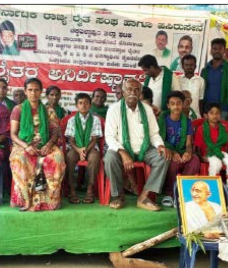
ಭತ್ತರಹಳ್ಳಿ ಬೈಲೇಗೌಡ ಮಾತನಾಡಿ, ಮುಚ್ಚಳಿ ಬರದಕೊಟ್ಟಿದ್ದರೂ ಸರ್ಕಾರ 'ರೈತರು ಜಮೀನು ನೀಡುವುದಿಲ್ಲ ಎಂದು ಬಲವಂತವಾಗಿ ಭೂಮಿ ಕಸಿದುಕೊಳ್ಳಲು

ಚಿಕ್ಕಬಳ್ಳಾಪುರ "ರಕ್ತ ಕೊಟ್ಟೆವು, ಕೃಷಿ ಭೂಮಿ ಕೊಡುವುದಿಲ್ಲ" ಕೆಂಬ ಎಂಬ ಘೋಷವಾಕ್ಯದೊಂದಿಗೆ ಕೆಂಬ ಎಂಬ ಭೂಸ್ವಾಧೀನ ಪ್ರಕ್ರಿಯೆ ವಿರೋಧಿಸಿ ರೈತರು ನಡೆಸುತ್ತಿರುವ ಅಹೋರಾತ್ರಿ ಧರಣಿ ಸತ್ಯಾಗ್ರಹವು ಶನಿವಾರ (ಏಪ್ರಿಲ್ 4) 21ನೇ ದಿನಕ್ಕೆ ಕಾಲಿಟ್ಟಿದೆ. ಶಿಕ್ಷಣಾತ್ಮಕ ತಾಲೂಕಿನ ಬಂಗಮನಕೋಟೆ ಹೋಬಳಿಯ 13 ಹಳ್ಳಿಗಳ ರೈತರು ಜಿಲ್ಲಾಧಿಕಾರಿ ಕಚೇರಿ ಎದುರು ಬೀಡುಬಿಟ್ಟಿದ್ದು, ಸರ್ಕಾರದ ವಿರುದ್ಧ ಆಕ್ರೋಶ ವ್ಯಕ್ತಪಡಿಸುತ್ತಿದ್ದಾರೆ.