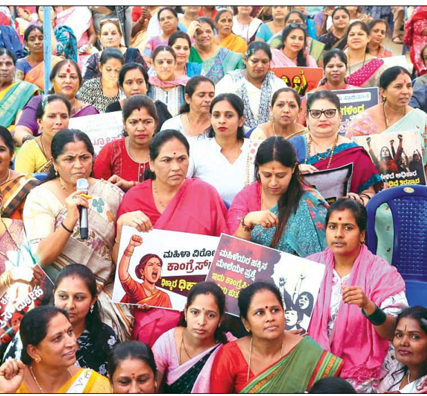
ಮಹಿಳಾ ಮೀಸಲಾತಿ ಮಸೂದೆ ಜಾರಿಯಾಗದಂತೆ ತಡೆದ ಕಾಂಗ್ರೆಸ್ ಮತ್ತು ಇಂದಿ ಮೈತ್ರಿ ಪಕ್ಷಗಳ ವಿರುದ್ಧ ಬೆಂಗಳೂರಿನ ಸ್ವಾತಂತ್ರ್ಯ ಉದ್ಯಾನದಲ್ಲಿ "ನಾರಿ ಶಕ್ತಿ ಪೂರಂ" ವತಿಯಿಂದ ಹಮ್ಮಿಕೊಂಡಿದ್ದ ಬೃಹತ್ ಪ್ರತಿಭಟನೆ ಉದ್ದೇಶಿಸಿ ಅವರು ಮಾತನಾಡಿದರು.

ಬೆಂಗಳೂರು:ರಾಜ್ಯದ ವಿಧಾನಸಭೆ ಮತ್ತು ದೇಶದ ಲೋಕಸಭೆಯಲ್ಲಿ ಮಹಿಳೆಯರ ಪ್ರಾತಿನಿಧ್ಯ ಜಾಸ್ತಿ ಆಗಬೇಕು. ಮಹಿಳೆಯರು ಕಾನೂನು ರೂಪಿಸುವ ಜವಾಬ್ದಾರಿಯುತ ಅಪಕಾಶ ಪಡೆಯಬೇಕು ಎಂದು ಮಹಿಳಾ ಮೀಸಲಾತಿ ಮಸೂದೆ ಜಾರಿಗೆ ಕೇಂದ್ರ ಸರ್ಕಾರ ಮುಂದಾಗಿತ್ತು ಎಂದು ಕೇಂದ್ರ ಸಚಿವೆ ಕು. ಶೋಭಾ ಕರಂದ್ಲಾಜೆ ಅವರು ಹೇಳಿದರು. ಸಂಸತ್ತಿನಲ್ಲಿ ಇತ್ತೀಚೆಗೆ ಮಂಡಿಸಿದ ಮಹಿಳಾ ಮೀಸಲಾತಿ ಮಸೂದೆ ಜಾರಿಯಾಗದಂತೆ ತಡೆದ ಕಾಂಗ್ರೆಸ್ ಮತ್ತು ಇಂದಿ ಮೈತ್ರಿ ಪಕ್ಷಗಳ ವಿರುದ್ಧ ಬೆಂಗಳೂರಿನ ಸ್ವಾತಂತ್ರ್ಯ ಉದ್ಯಾನದಲ್ಲಿ "ನಾರಿ ಶಕ್ತಿ ಪೂರಂ" ವತಿಯಿಂದ ಹಮ್ಮಿಕೊಂಡಿದ್ದ ಬೃಹತ್ ಪ್ರತಿಭಟನೆ ಉದ್ದೇಶಿಸಿ ಅವರು ಮಾತನಾಡಿದರು.