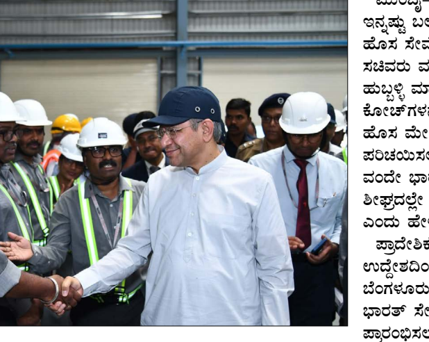
ಇವು ಪ್ರಮುಖ ನಗರಗಳ ನಡುವಿನ ದೂರವನ್ನು ಪರಿಣಾಮಕಾರಿಯಾಗಿ ಕಡಿಮೆ ಮಾಡುವುದರ ಮೂಲಕ ಅವುಗಳನ್ನು ಒಂದೇ ವಿಶ್ವ ನಗರ ವ್ಯವಸ್ಥೆಯಾಗಿ ರೂಪಿಸುವುದಕ್ಕೆ ಸಹಾಯ ಮಾಡುತ್ತವೆ ಎಂದು ಹೇಳಿದರು. ಉದಾಹರಣೆಗೆ, ಚೆನ್ನೈ ಮತ್ತು ಬೆಂಗಳೂರು ನಡುವಿನ ಪ್ರಯಾಣದ ಅವಧಿ ಕೇವಲ 73 ನಿಮಿಷಗಳಿಗೆ ಇಳಿಯುವ ಸಾಧ್ಯತೆ ಇದೆ ಎಂದು ತಿಳಿಸಿದರು.

ಬೆಂಗಳೂರು: ಕೇಂದ್ರ ರೈಲ್ವೆ ಮಾಹಿತಿ ಮತ್ತು ಪ್ರಸಾರ ಹಾಗೂ ಎಲೆಕ್ಟ್ರಾನಿಕ್ಸ್ ಮತ್ತು ಮಾಹಿತಿ ತಂತ್ರಜ್ಞಾನ ಸಚಿವ ಅಶ್ವಿನಿ ವೈಷ್ಣವ್ ಅವರು ಇಂದು ಬೆಂಗಳೂರಿನ ಬಿಇಎಂಎಲ್ ತೀವ್ರವೃದ್ಧಿ ಕ್ಯಾಂಪಸ್ ಗೆ ಭೇಟಿ ನೀಡಿ, ಹೈ ಸ್ಪೀಡ್ ರೈಲು ತಯಾರಿಕೆಗೆ ಮೀಸಲಾಗಿರುವ ವಿಶೇಷ ಸಂಕೀರ್ಣ 'ಆದಿತ್ಯ' ಅನ್ನು ಉದ್ಘಾಟಿಸಿದರು. ಈ ಸಂದರ್ಭದಲ್ಲಿ ಮಾತನಾಡಿದ ಸಚಿವರು, ಹೈ ಸ್ಪೀಡ್ ರೈಲು ತಂತ್ರಜ್ಞಾನವು ಅತ್ಯಂತ ಸಂಕೀರ್ಣ ಮತ್ತು ಉನ್ನತ ಮಟ್ಟದ ತಾಂತ್ರಿಕತೆಯನ್ನು ಒಳಗೊಂಡಿದ್ದು, ಅದರ ಸ್ವದೇಶೀ ಅಭಿವೃದ್ಧಿ ಭಾರತದ ಎಂಜಿನಿಯರಿಂಗ್ ಕ್ಷೇತ್ರದಲ್ಲಿ ಮಹತ್ವದ ಮೈಲಿಗಲ್ಲಾಗಿದೆ ಎಂದು ಹೇಳಿದರು. ಹೊಸದಾಗಿ ಉದ್ಘಾಟಿಸಲಾದ 'ಆದಿತ್ಯ' ಸಂಕೀರ್ಣ ಪ್ರಸ್ತುತ ಬಿ-28 ಕೋಚ್‌ಗಳ ಅಭಿವೃದ್ಧಿಗೆ ವಿನ್ಯಾಸಗೊಳಿಸಲಾಗಿದೆ. ಹೈ ಸ್ಪೀಡ್ ರೈಲುಗಳ ಪರಿವರ್ತಕ ತತ್ವವನ್ನು ಉಲ್ಲೇಖಿಸಿದ ಸಚಿವರು,