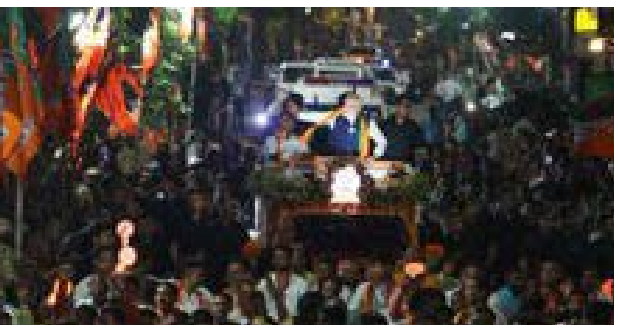
ಬಂಗಾಳದ ಪ್ರತಿಯೊಬ್ಬ ಸಹೋದರಿ ಮತ್ತು ಮಗಗಳು ಈಗ ದಯೆಯಿಲ್ಲದ ಸಾಮೂಹಿಕ ಅತ್ಯಾಚಾರ ಮತ್ತು ಕೊಲೆಗಳು

ಕೋಲ್ಕತ್ತಾ: ಎರಡನೇ ಹಂತದ ಚುನಾವಣೆ ಹೊತ್ತಲ್ಲಿ ಪ್ರಧಾನಿ ನರೇಂದ್ರ ಮೋದಿ ಅವರು ಸಿಎಂ ಮತ್ತು ಬ್ಯಾನರ್ಜಿ ಅವರ ಟಿಎಂಪಿ ಪಕ್ಷವನ್ನು ತರಾಟೆಗೆ ತೆಗೆದುಕೊಂಡಿದ್ದಾರೆ. ಪಟ್ಟಿಮ ಬಂಗಾಳದಲ್ಲಿ ತಾಯಿ ಕಣ್ಮೀರಿಡುತ್ತಿದ್ದಾಳೆ, ರಾಜ್ಯವು ಒಳನುಸುಳಿಗಳಿಂದ ತುಂಬಿದೆ, ಇಲ್ಲಿನ ಜನರು ಭಯಭೀತರಾಗಿದ್ದಾರೆಂದು ದೀದಿ ಆಡಳಿತವನ್ನು ಮೋದಿ ಟೀಕಿಸಿದರು. ಬಂಗಾಳದಲ್ಲಿ ಮಹಿಳೆಯರಿಗೆ ಭದ್ರತೆ ಒದಗಿಸುವಲ್ಲಿ ತೃಣಮೂಲ ಕಾಂಗ್ರೆಸ್ ವಿಫಲವಾಗಿದೆ. ಕೋಲ್ಕತ್ತಾದ ಆರ್‌ಜಿ