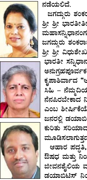
ನಡೆಯಲಿದೆ. ಜಗದ್ಗುರು ಶಂಕರಾಚಾರ್ಯ ಶ್ರೀ ಶ್ರೀ ಭಾರತಿತೀರ್ಥ ಮಹಾಸ್ವಾಮಿಧಾನಗಳವರ ಮತ್ತು ಜಗದ್ಗುರು ಶಂಕರಾಚಾರ್ಯ ಶ್ರೀ ಶ್ರೀ ವಿಭೂತಿಶಂಕರ ಭಾರತಿ ಸನ್ನಿಧಾನಗಳವರ ಅನುಗ್ರಹಪೂರ್ವಕವಾದ ಕೃಪಾಶೀರ್ವಾದ “ಆರೋಗ್ಯದಲ್ಲಿ ಸಿಹಿ - ನಮದಿಯ ಜೀವನಕ್ಕೆ ನೆನಪಿರಬೇಕಾದ ನಿಯಮಗಳು” ಎಂಬ ಶಿರ್ಷಿಕೆಯೊಂದಿಗೆ ಜನರಲ್ಲಿ ಡಯಾಬಿಟೀಸ್ ಕುರಿತು ಸರಿಯಾದ ಜಾಗೃತಿ ಮೂಡಿಸಲಾಗುತ್ತದೆ. ಆಹಾರ ಪದ್ಧತಿ, ಯೋಗ, ಔಷಧ ಮತ್ತು ನಿಯಮಿತ ಜೀವನಶೈಲಿಯ ಮೂಲಕ ಡಯಾಬಿಟೀಸ್ ನಿಯಂತ್ರಣದಲ್ಲಿ ಇರಿಸಿಕೊಂಡು ನಮದಿಯ ಮತ್ತು ಆರೋಗ್ಯಕರ ಜೀವನ ನಡೆಸಲು ಮಾರ್ಗದರ್ಶನ ನೀಡುವುದು ಈ ಕಾರ್ಯಕ್ರಮದ ಉದ್ದೇಶವಾಗಿದೆ. ಡಯಾಬಿಟೀಸ್ ಹಾಗೂ ಶ್ರೀ-

ಬಿಜ್ಜಿ ಶ್ರೀ ಶ್ರೀ ಜಗದ್ಗುರು ಶಂಕರಾಚಾರ್ಯ ಮಹಾಸ್ವಾಮಿ ದಕ್ಷಿಣಾಮೃತ ಶೃಂಗೇರಿ ಶ್ರೀ ಶಾರದಾ ಪೀಠ ಶೃಂಗೇರಿ, ಅಹಂ ಬ್ರಹ್ಮಾಸ್ಮಿ ಪ್ರತಿಷ್ಠಾನ, ಶಾಂತಕರ್ತವ್ಯ ಪ್ರಸಾರ ಅಭಿಯಾನ, ಶೃಂಗೇರಿ ಹಾಗೂ ಶ್ರೀ ಶೃಂಗೇರಿ ಶಂಕರಮಠ ಸಂಗನಕಲ್ಪ ರಸ್ತೆ ಹಾಗೂ ಸಭಾಪತಿ ಬೀದಿ ಬಳ್ಳಾರಿ ಇವರ ಸಂಯುಕ್ತಶ್ರಮದಲ್ಲಿ ಮೇ 9 ರಂದು ಡಯಾಬಿಟೀಸ್ ರೋಗಿಗಳಿಗಾಗಿ ಬೃಹತ್ ಆರೋಗ್ಯ ಜಾಗೃತಿ ಹಾಗೂ ಮಾರ್ಗದರ್ಶನ ಕಾರ್ಯಕ್ರಮ ಆಯೋಜಿಸಲಾಗಿದೆ. 1000ಕ್ಕೂ ಹೆಚ್ಚು ಡಯಾಬಿಟೀಸ್ ರೋಗಿಗಳಿಗಾಗಿ ಅಂದು ಸಂಜೆ 5 ಗಂಟೆಯಿಂದ ಸಂಗನಕಲ್ಪ ರಸ್ತೆಯ ಶ್ರೀ ಶೃಂಗೇರಿ ಶಂಕರ ಮಠದ ಶ್ರೀ ಭಾರತಿ ತೀರ್ಥ ಸಭಾಭವನದಲ್ಲಿ ಈ ಕಾರ್ಯಕ್ರಮ