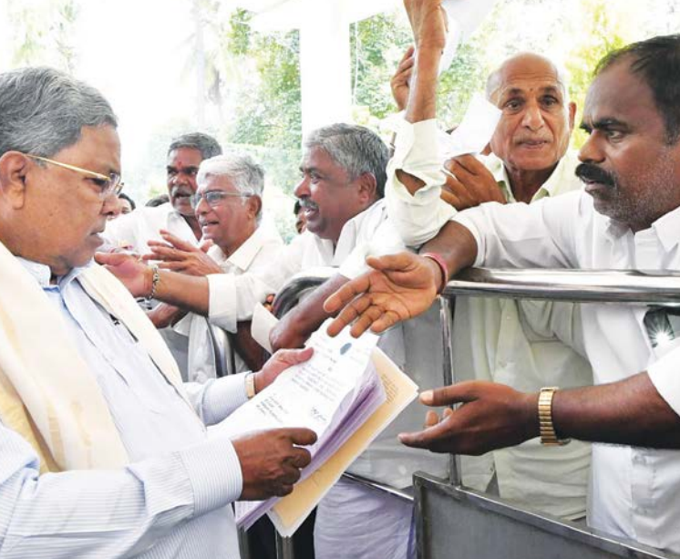
ಗುರುವಾರ ಮುಖ್ಯಮಂತ್ರಿ ಸಿದ್ದರಾಮಯ್ಯ ಅವರು ಕಾವೇರಿ ನಿವಾಸದಲ್ಲಿ ಸಾರ್ವಜನಿಕ ಅಹವಾಲು ಸ್ವೀಕರಿಸಿದರು.

ಇದಕ್ಕಿಂತ ಉತ್ತಮ ಡೀಲ್ ದಕ್ಷಿಣಕ್ಕೆ ಸಿಗುತ್ತಿಲ್ಲ. ದಕ್ಷಿಣಕ್ಕೆ ಅನ್ಯಾಯವಾಗಿದ್ದರೆ 'ಹೆಮ್ಮೆಯ ಕನ್ನಡಿಗ'ನಾಗಿ ನಾನು ವಿರೋಧಿಸುತ್ತಿದ್ದೆ. ದಕ್ಷಿಣಕ್ಕೆ ಅನ್ಯಾಯ ಮಾಡುತ್ತಿದ್ದಾರೆ ಎಂದು ವಿಪಕ್ಷಗಳು ಜನರ ದಾರಿ ತಪ್ಪಿಸುತ್ತವೆ ಎಂದು ತಿಳಿದರು.