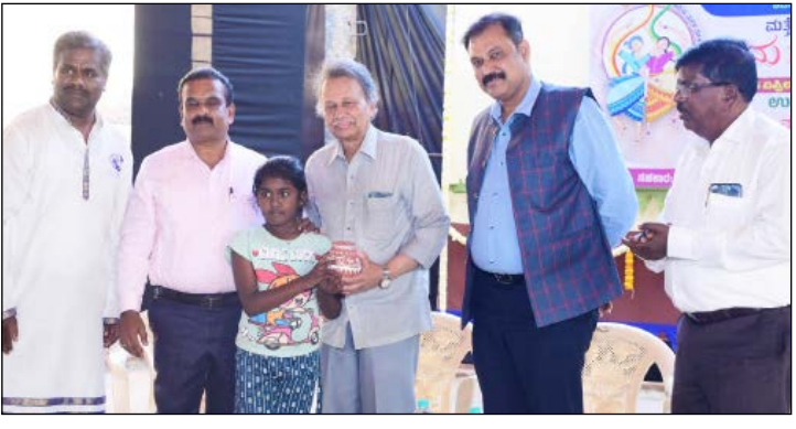
ಬರಗೂರು, “ಪರಂಪರೆ ಎಂದರೆ ದಡ ಸಂಪ್ರದಾಯವಲ್ಲ. ಅದು ಚಲನಶೀಲವಾದುದು. ಪರಂಪರೆಯ ಪ್ರಜ್ಞೆ ಇಲ್ಲದೆ ವರ್ತಮಾನವನ್ನು ಅರ್ಥಮಾಡಿಕೊಳ್ಳಲು ಮತ್ತು ಭವಿಷ್ಯವನ್ನು ಕಟ್ಟಲು ಸಾಧ್ಯವಿಲ್ಲ. ಅಂಬೇಡ್ಕರ್ ಅವರು

ಕೋಲಾರ “ಇವತ್ತು ಮಾನವೀಯತೆಯ ಜಾಗದಲ್ಲಿ ಅವನವಿಯತೆ ಮತ್ತು ವಿವೇಕದ ಜಾಗದಲ್ಲಿ ಅವಿವೇಕ ತುಂಬುವ ಆತಂಕಕಾರಿ ಸಂದರ್ಭದಲ್ಲಿದ್ದೇವೆ. ಇಂತಹ ಕಾಲಘಟ್ಟದಲ್ಲಿ ಮಕ್ಕಳ ಮನಸ್ಸಿನೊಳಗೆ ಅಂಬೇಡ್ಕರ್, ಬಸವಣ್ಣ, ಬುದ್ಧ ಹಾಗೂ ಗಾಂಧೀಜಿಯವರಂತಹ ಮಹನೀಯರ ವಿಚಾರಧಾರೆಗಳು ಮೊಳೆಯಬೇಕು” ಎಂದು ಖ್ಯಾತ ಸಾಹಿತಿ ನಾಡೋಜ ಬರಗೂರು ರಾಮಚಂದ್ರಪ್ಪ ತಿಳಿಸಿದರು. ತೇರಕ್ಕಳ್ಳಿ ಬೆಟ್ಟದ ತೀರ್ಥದಲ್ಲಿ ಆದಿಮ ಸಾಂಸ್ಕೃತಿಕ ಕೇಂದ್ರದಲ್ಲಿ ಆಯೋಜಿಸಲಾಗಿರುವ **ಬೇಸಿಗೆ ಶಿಬಿರ ಮಕ್ಕಳ ಮೇಲೆ-2026**ಕ್ಕೆ ರಾಗಿಲ್ಲ ಬೀಸುವ ಮೂಲಕ ಪಾರಂಪರಿಕವಾಗಿ ಚಾಲನೆ ನೀಡಿ ಅವರ ಮಾತನಾಡಿದರು. ಮಕ್ಕಳನ್ನು ಉದ್ದೇಶಿಸಿ ಮಾತನಾಡಿದ