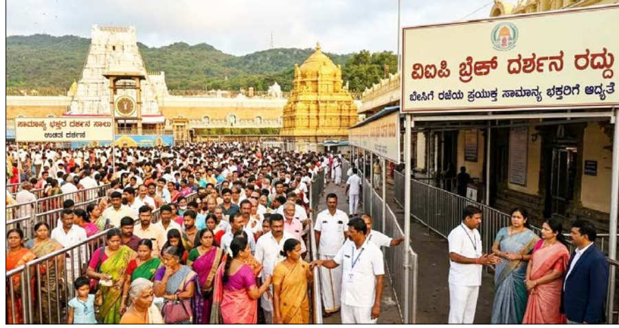
ಗಾಯೀ 2 ರಿಂದ 3 ಗಂಟೆಗಳ ಸಮಯ ವ್ಯಯ ವಾಗುತ್ತಿದೆ. ಒಂದು ವೇಳೆ ಈ ವಿವಿಧ ದರ್ಶನ ವ್ಯಕ್ತಿಯ ಏಕಮಾತ್ರ ದರ್ಶನ ವ್ಯವಸ್ಥೆಯನ್ನು ಮೇ, ಜೂನ್ ಗಳನ್ನು ರದ್ದುಗೊಳಿಸಿದರೆ, ಆ ಸಮಯದಲ್ಲಿ ಹೆಚ್ಚುವರಿ 15 ಸಾವಿರ ಸಾಮಾನ್ಯ ಭಕ್ತರಿಗೆ ದರ್ಶನ ಭಾಗ್ಯ ಕಲ್ಪಿಸಬಹುದು ಎಂಬುದು ಅಧಿಕಾರಿಗಳ ಲೆಕ್ಕಾಚಾರ. ದೇಶದ ಪ್ರತಿ ಪ್ರಜೆ ಗೌರವ ಮತ್ತು ಸ್ವಾಭಿಮಾನದಿಂದ ಬದುಕಬೇಕು. ಸಮ ಸಮಾಜ ನಿರ್ಮಾಣವಾಡಬೇಕು ಎಂಬುದು ಅವರ ಮಹಾಧಾರವಾಗಿಯೇ ಇದೆ ಎಂದರು.

ತಿರುಮಲ ಬೇಸಿಗೆ ರಜೆಯ ಹಿನ್ನೆಲೆಯಲ್ಲಿ ತೀವ್ರ ದರ್ಶನಕ್ಕೆ ಬರುವ ಭಕ್ತರ ಸಂಖ್ಯೆ ಗಣನೀಯವಾಗಿ ಏರಿಕೆಯಾಗುತ್ತಿದ್ದು, ಸಾಮಾನ್ಯ ಭಕ್ತರಿಗೆ ಹೆಚ್ಚಿನ ಆದ್ಯತೆ ನೀಡಲು ತಿರುಮಲ ತಿರುಪತಿ ದೇವಸ್ಥಾನಂ ಮಹತ್ವದ ನಿರ್ಧಾರ ಕೈಗೊಳ್ಳಲು ಮುಂದಾಗಿದೆ. ತಾಲಾ-ಕಾಲೇಜುಗಳಿಗೆ ರಜೆ ಇರುವುದರಿಂದ ಪೋಷಕರು ಮಕ್ಕಳೊಂದಿಗೆ ಹೆಚ್ಚಿನ ಸಂಖ್ಯೆಯಲ್ಲಿ ಆಗಮಿಸುತ್ತಿದ್ದು, ಜನದಟ್ಟಣೆಯನ್ನು ನಿವಾರಿಸಲು ದರ್ಶನ ನೀತಿಯಲ್ಲಿ ಬದಲಾವಣೆ ತರಲಾಗುತ್ತಿದೆ. ಪ್ರಸ್ತುತ ಜಾರಿಯಲ್ಲಿರುವ ಸ್ಟಾಟಿಕ್ ಸರ್ವ ದರ್ಶನ ಟೋಕನ್‌ಗಳ ಮೂಲಕ ದರ್ಶನ ಪಡೆಯಲು ಭಕ್ತರು ಸುಮಾರು 23 ಗಂಟೆಗಳ ಕಾಲ ಕಾಯಬೇಕಾದ ಪರಿಸ್ಥಿತಿ ಇದೆ. ಇದನ್ನು ಗಮನದಲ್ಲಿಟ್ಟುಕೊಂಡು, ಮೇ 1 ರಿಂದ ಎಸ್‌ಎಸ್‌ಡಿ ಟೋಕನ್‌ಗಳು ಹಾಗೂ ವಿವಿಧ ಬ್ರೇಕ್ ದರ್ಶನಗಳನ್ನು ತಾತ್ಕಾಲಿಕವಾಗಿ ರದ್ದುಗೊಳಿಸಲು ಟಿಪಿಡಿ ಯೋಜಿಸುತ್ತಿದೆ. ಇದರಿಂದಾಗಿ ಸಾಮಾನ್ಯ ಭಕ್ತರು 8 ರಿಂದ 12 ಗಂಟೆಗಳ ಒಳಗೆ ದರ್ಶನ ಪಡೆಯಲು ಸಾಧ್ಯವಾಗಲಿದೆ. ಸಾಮಾನ್ಯವಾಗಿ ಪ್ರತಿದಿನ ವಿವಿಧ ಬ್ರೇಕ್ ದರ್ಶನಗಳ