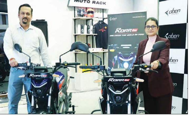
ಒಬೆನ್ ಎಲೆಕ್ಟ್ರಿಕ್ ತನ್ನ ಹೊಸದಾಗಿ ಬಿಡುಗಡೆಯಾದ “ನ್ಯೂ ರೋಡ್ ಇಎಫಿ” ಎಲೆಕ್ಟ್ರಿಕ್ ಮೋಟಾರ್‌ಸೈಕಲ್‌ನಿಗೆ ಬೆಂಗಳೂರಿನ ಎಚ್‌ಎಸ್‌ಆರ್ ಲೇಔಟ್ ಪ್ರಮುಖ ಶೋರೂಂನಲ್ಲಿ ವಿಶೇಷ ಪ್ರದರ್ಶನ ಕಾರ್ಯಕ್ರಮವನ್ನು ಆಯೋಜಿಸಿದೆ.