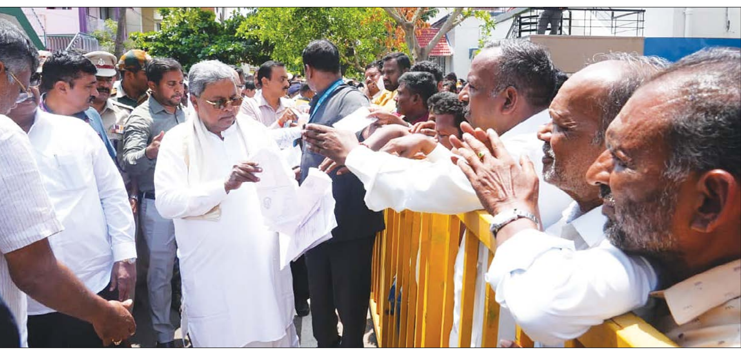
ಗುರುವಾರ ಮುಖ್ಯಮಂತ್ರಿ ಸಿದ್ದರಾಮಯ್ಯ ಅವರು ಮೈಸೂರಿನ ತಮ್ಮ ನಿವಾಸದ ಬಳಿ ಸಾರ್ವಜನಿಕರ ಅಹವಾಲು ಆಲಿಸಿದರು.

ನವದೆಹಲಿ: ತೈಲ ಬಿಕ್ಕಟ್ಟಿನ ಹಿನ್ನೆಲೆಯಲ್ಲಿ ಪ್ರಧಾನಿ ನರೇಂದ್ರ ಮೋದಿ ಇಂಧನ ಉಳಿತಾಯಕ್ಕಾಗಿ 'ವರ್ಕಾಪ್ರಮ್' ಹೋಮ್ ಮಾಡುವಂತೆ ಸಲಹೆ ನೀಡಿದ್ದೇ ತಡ, ದೆಹಲಿ ಮುಖ್ಯಮಂತ್ರಿ ರೇಖಾ ಗುಪ್ತಾ ಅವರು ಗುರುವಾರ ಸರ್ಕಾರದ ನೌಕರರಿಗೆ ವಾರಕ್ಕೆ ಎರಡು ದಿನ ಮನೆಯಿಂದಲೇ ಕೆಲಸ ಮತ್ತು ವಾಹನಗಳ ಕನಿಷ್ಠ ಬಳಕೆ ಘೋಷಿಸಿದ್ದಾರೆ. ದೆಹಲಿ ಸರ್ಕಾರದ ಈ ನಿರ್ಧಾರ ಇಂಧನ ಉಳಿತಾಯ ಮತ್ತು ದಕ್ಕ ಅಡಳಿತವನ್ನು ಉತ್ತೇಜಿಸಲು ಬಿಜೆಪಿ ನೇತೃತ್ವದ ಸರ್ಕಾರ ರಾಜ್ಯ ರಾಜಧಾನಿಯಲ್ಲಿ "ಮೇರಾ ಭಾರತ್ ಮೇರಾ ಯೋಗದಾನ್" (ನನ್ನ ಭಾರತ, ನನ್ನ ಕೊಡುಗೆ) ಅಭಿಯಾನವನ್ನು ಪ್ರಾರಂಭಿಸುತ್ತಿದೆ.