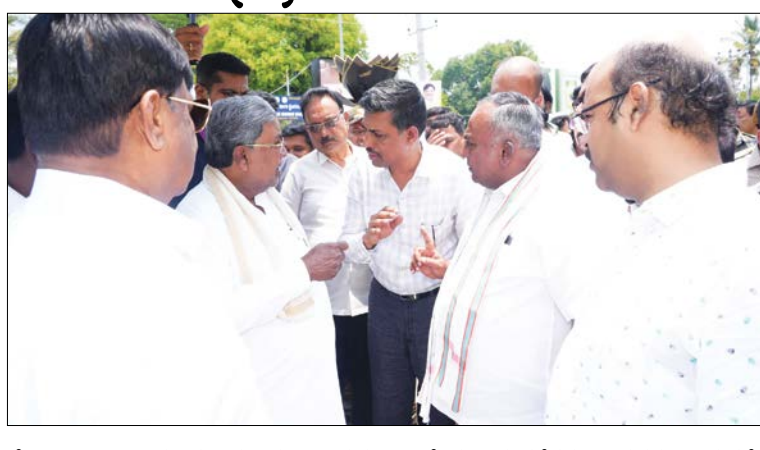
ಮೈಸೂರಿನ ರಸ್ತೆಗಳು, ಒಳಚರಂಡಿ ವ್ಯವಸ್ಥೆ ಸೇರಿದಂತೆ ಎಲ್ಲ ಅಭಿವೃದ್ಧಿ ಕಾರ್ಯಗಳನ್ನು ನಮ್ಮ ಸರ್ಕಾರವೇ ಕೈಗೊಂಡಿದ್ದು, ಬಿಜೆಪಿಯವರು ಕೇವಲ ಸರ್ಕಾರವನ್ನು ನಿರಾಧಿಪತಿಸಿ, ಟೀಕಿಸುವ, ಸುಳ್ಳು ಹೇಳುವ ಕೆಲಸದಲ್ಲಿ ನಿರತರಾಗಿದ್ದಾರೆ. ಜನರಿಗೆ ಅನುಕೂಲ ಕಲ್ಪಿಸುವ ಯಾವುದೇ ಯೋಜನೆಗಳನ್ನು ಬಿಜೆಪಿಯು ತನ್ನ ಅಧಿಕಾರಾವಧಿಯಲ್ಲಿ ಕೈಗೊಳ್ಳಲಿಲ್ಲ ಎಂದರು.

ಮೈಸೂರು: ನಗರದ ಅಭಿವೃದ್ಧಿ ಕಾಮಗಾರಿಗಳು ನಿಗದಿತ ಅವಧಿಯಲ್ಲಿ ಪೂರ್ಣಗೊಳ್ಳುವ ಜೊತೆಗೆ ಗುಣಮಟ್ಟದಿಂದ ಕೂಡಿರಬೇಕು ಎಂದು ಅಧಿಕಾರಿಗಳ ಸ್ಪಷ್ಟ ನಿರ್ದೇಶನಗಳನ್ನು ನೀಡಿದ್ದೇನೆ ಎಂದು ಮುಖ್ಯಮಂತ್ರಿ ಸಿದ್ದರಾಮಯ್ಯ ತಿಳಿಸಿದರು. ಅವರು ಮೈಸೂರಿನ ವಿವಿಧ ವಿಧಾನಸಭಾ ಕ್ಷೇತ್ರಗಳಲ್ಲಿ ಪ್ರಗತಿಯಲ್ಲಿರುವ ಅಭಿವೃದ್ಧಿ ಕಾರ್ಯಗಳನ್ನು ಪರಿವೀಕ್ಷಣೆ ನಡೆಸಿ ಮಾಧ್ಯಮದವರೊಂದಿಗೆ ಮಾತನಾಡಿದರು. ಕೆ.ಟಿ.ಎಲ್ ನ ವತಿಯಿಂದ ಸುಮಾರು 871 ಕಿ.ಮೀ. ಕೆ.ಬಿ.ಎಲ್ ಗಳನ್ನು ಹಾಕಲಾಗುತ್ತಿದ್ದು, ಇದುವರೆಗೆ 277 ಕಿ.ಮೀ.ಪೂರ್ಣಗೊಂಡಿದ್ದು, ಕಾಮಗಾರಿ ಪ್ರಗತಿಯಲ್ಲಿದೆ. ಇದರಿಂದ ಮೈಸೂರು ನಗರದ ಸೌಂದರ್ಯೋತ್ಸರ್ಗಕ್ಕೆ ಸಹಕಾರಿಯಾಗಿದೆ ಎಂದರು. ಮಹಾರಾಣಿ ಕಾಲೇಜಿನ ವಿದ್ಯಾರ್ಥಿ ನಿಲಯಗಳಿಗೆ ಸೂಕ್ತ ಸೃಷ್ಟಿಕಾರವಿರುವ ಕಾರಣ, ಪ್ರಸ್ತುತ 1400 ವಿದ್ಯಾರ್ಥಿಗಳಿಗೆ ಅನುಕೂಲವಾಗುವಂತೆ ಹೊಸ ವಿದ್ಯಾರ್ಥಿ ನಿಲಯವನ್ನು ನಿರ್ಮಿಸಲಾಗುತ್ತಿದೆ ಎಂದು ನಗರದಲ್ಲಿ ಸುಮಾರು 50 ಕಿ.ಮೀ.ನ ರಸ್ತೆಯಲ್ಲಿ ದಟ್ಟಣೆ ಸಮಸ್ಯೆ ಪರಿಹಾರವಾಗಲಿದೆ ಎಂದರು.