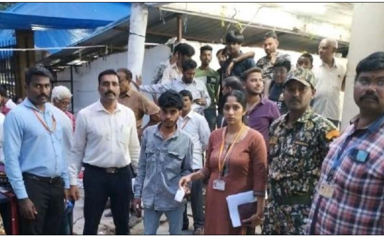
ದಾಖಲಿಸಿ, ಉಲ್ಲಂಘನೆಯಾದರೂ 88,200 ದಂಡ ವಿಧಿಸಲಾಗಿದೆ ಎಂದು ಆಯುಕ್ತರು ತಿಳಿಸಿದ್ದಾರೆ. ಸಾರ್ವಜನಿಕ ಸುಗಮ ಸಂಚಾರಕ್ಕೆ ಅಡ್ಡಿಯಾಗುವಂತಹ ಯಾವುದೇ ರೀತಿಯ ಒತ್ತುವರಿಯನ್ನು ಸಹಿಸಲಾಗುವುದಿಲ್ಲ ಎಂಬ ಸ್ಪಷ್ಟ ಸಂದೇಶವನ್ನು ನೀಡಿರುವ ಪಾಲಿಕೆ, ಎಲ್ಲಾ ಅಂಗಡಿ ಮಾಲೀಕರಿಗೂ ಎಚ್ಚರಿಕೆ ನೀಡಿದೆ. ಸಂಪೂರ್ಣವಾಗಿ ಒತ್ತುವರಿ

ಬೆಂಗಳೂರು ದಕ್ಷಿಣ ನಗರ ಪಾಲಿಕೆ ವ್ಯಾಪ್ತಿಗೆ ಒಳಪಟ್ಟ ಜಯನಗರ ವಾಣಿಜ್ಯ ಸಂಕೀರ್ಣದಲ್ಲಿ ಒತ್ತುವರಿ ತೆರವು ಕಾರ್ಯಾಚರಣೆ ನಡೆಸಲಾಗಿದ್ದು, ಒಟ್ಟು 88,200 ದಂಡ ವಸೂಲಿ ಮಾಡಲಾಗಿದೆ ಎಂದು ಆಯುಕ್ತ ಕೆ.ಎನ್. ರಮೇಶ್ ತಿಳಿಸಿದ್ದಾರೆ. ಸುಮಾರು 15,000 ಚದರ ಅಡಿ ವಿಸ್ತೀರ್ಣ ಹೊಂದಿರುವ ಈ ಸಂಕೀರ್ಣದಲ್ಲಿ 270ಕ್ಕೂ ಹೆಚ್ಚು ಅಂಗಡಿಗಳು ಕಾರ್ಯನಿರ್ವಹಿಸುತ್ತಿದ್ದು, ಕಾರಿಡಾರ್‌ಗಳು, ಪಾದಚಾರಿ ಮಾರ್ಗಗಳು ಮತ್ತು ಸಾರ್ವಜನಿಕ ಸ್ಥಳಗಳನ್ನು ಅಂಗಡಿ ಮಾಲೀಕರು ಹಾಗೂ ವ್ಯಾಪಾರಿಗಳು ಅತಿಕ್ರಮಿಸಿಕೊಂಡಿರುವ ಬಗ್ಗೆ ಸಾರ್ವಜನಿಕರಿಂದ ಹಲವು ದೂರುಗಳು ಬಂದಿದ್ದವು. ಈ ಒನ್ನೆಯಲ್ಲಿ ಕಳೆದ ಮೂರು ದಿನಗಳಿಂದ ಪಾಲಿಕೆ ಅಧಿಕಾರಿಗಳು ಅಂಗಡಿ ಮಾಲೀಕರಿಗೆ ತಮ್ಮ ವ್ಯಾಪ್ತಿಯನ್ನು ಮೀರಿದ ಅನಧಿಕೃತ ಒತ್ತುವರಿಯನ್ನು ಸ್ವಯಂಪ್ರೇರಿತವಾಗಿ ತೆರವುಗೊಳಿಸುವಂತೆ ಜಾಗೃತಿ ಮೂಡಿಸಿದ್ದರು. ಆದಾಗ್ಯೂ, ಸೂಚನೆಗಳ ನಂತರವೂ ಒತ್ತುವರಿ ಮುಂದುವರಿದ ಒನ್ನೆಯಲ್ಲಿ ಪಾಲಿಕೆಯಿಂದ ಕಠಿಣ ಕ್ರಮ ಕೈಗೊಳ್ಳಲಾಗಿದೆ. ಕಾರಿಡಾರ್ ಮತ್ತು ಪಾದಚಾರಿ ಮಾರ್ಗಗಳನ್ನು ಅತಿಕ್ರಮಿಸಿರುವ ಒನ್ನೆಯಲ್ಲಿ ಒಟ್ಟು 39 ಪ್ರಕರಣಗಳನ್ನು