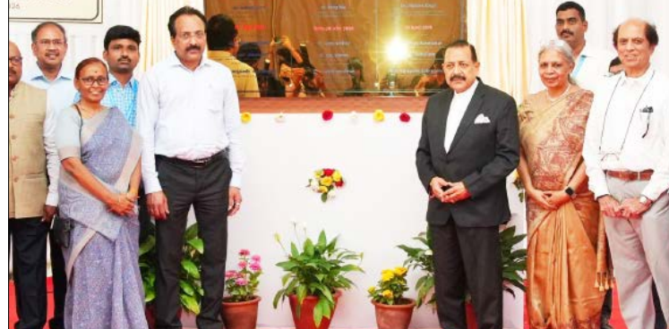
ಇದು ಮಹತ್ವದ ಹೆಜ್ಜೆಯಾಗಿದೆ ಎಂದು ಸಚಿವರು ಹೇಳಿದರು. ಸಚಿವರು ಮಾತನಾಡುತ್ತಾ, ಬಾಹ್ಯಾಕಾಶ, ರಕ್ಷಣಾ ಹಾಗೂ ಅಂತರರಾಷ್ಟ್ರೀಯ ವಲಯಗಳಲ್ಲಿ ಬಳಕೆಯಾಗುತ್ತಿರುವ ಸುಧಾರಿತ ಖಗೋಳ ಉಪಕರಣಗಳಲ್ಲಿ ಭಾರತದ ಸ್ಥಳೀಯ ತಂತ್ರಜ್ಞಾನ ಸಾಮರ್ಥ್ಯವನ್ನು ಸಂಪೂರ್ಣವಾಗಿ ಬಳಸಿಕೊಳ್ಳಲಾಗುತ್ತಿದೆ ಎಂದು ತಿಳಿಸಿದರು. ಐ.ಐ.ಎ.ಯಲ್ಲಿ ಅಭಿವೃದ್ಧಿಪಡಿಸಲಾದ ಅತ್ಯಾಧುನಿಕಗಳನ್ನು, ಇನ್ನೂ ಸೇರಿದಂತೆ ಹಲವು ರಾಷ್ಟ್ರೀಯ ಮತ್ತು ಅಂತರರಾಷ್ಟ್ರೀಯ ಬಾಹ್ಯಾಕಾಶ ಕಾರ್ಯಾಚರಣೆಗಳಲ್ಲಿ ಬಳಸಲಾಗುತ್ತಿದೆ ಎಂದು

ಬೆಂಗಳೂರು ಭಾರತೀಯ ಖಗೋಳ ಭೌತಶಾಸ್ತ್ರ ಸಂಸ್ಥೆ (ಐ.ಐ.ಎ.)ಯಲ್ಲಿ 75 ಕೋಟಿ ವೆಚ್ಚದ ಅತ್ಯಾಧುನಿಕ ಹೊಸ ಹೆಚ್ಚುವರಿ ಕಟ್ಟಡಕ್ಕೆ ಕೇಂದ್ರ ಸಚಿವರಾದ ಡಾ. ಚತೇಂದ್ರ ಸಿಂಗ್ ಶಂಕುಸ್ಥಾಪನೆ ನೆರವೇರಿಸಿದರು. ಕೋರಮಂಜಿರದಲ್ಲಿರುವ ಸಂಸ್ಥೆಯ ಆವರಣದಲ್ಲಿ ನಡೆದ ಈ ಕಾರ್ಯಕ್ರಮದಲ್ಲಿ ವಿಜ್ಞಾನಿಗಳು, ಸಂಶೋಧಕರು ಹಾಗೂ ವಿವಿಧ ಇಲಾಖೆಗಳ ಅಧಿಕಾರಿಗಳು ಉಪಸ್ಥಿತರಿದ್ದರು. ಈ ನೂತನ ಕಟ್ಟಡವು ಏಳು ಅಂತಸ್ತಿನದಾಗಿದ್ದು, ಸುಮಾರು 1000 ಲಕ್ಕ ಚದರ ಅಡಿ ವಿಸ್ತೀರ್ಣದಲ್ಲಿ ನಿರ್ಮಾಣವಾಗಿದೆ. ದೇಶದ ಪ್ರಮುಖ ವೈಜ್ಞಾನಿಕ ಕೇಂದ್ರಗಳಲ್ಲಿ ಒಂದಾಗಿ ಇದನ್ನು ಅಭಿವೃದ್ಧಿಪಡಿಸಲಾಗುತ್ತಿದ್ದು, ಖಗೋಳಶಾಸ್ತ್ರ ಮತ್ತು ಖಗೋಳ ಭೌತಶಾಸ್ತ್ರ ಕ್ಷೇತ್ರದಲ್ಲಿ ಭಾರತದ ಸಾಮರ್ಥ್ಯವನ್ನು ಮತ್ತಷ್ಟು ಬಲಪಡಿಸುವ ಉದ್ದೇಶ ಹೊಂದಿದೆ. ವಿಶ್ವ ದರ್ಜೆಯ, ಭವಿಷ್ಯಮುಖ ಸಂಶೋಧನೆಗಳಿಗೆ