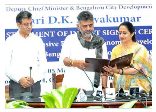
Deputy Chief Minister & Bengaluru City Development Officer D.K. Shivakumar