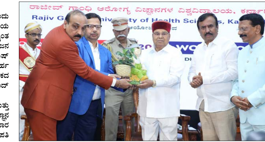
ರಾಜೀವ್ ಗಾಂಧಿ ಆರೋಗ್ಯ ವಿಜ್ಞಾನಗಳ ವಿಶ್ವವಿದ್ಯಾಲಯ, ಕರ್ನಾಟಕದ ಹೋಮಿಯೋಪತಿ ದಿನಾಚರಣೆಯಲ್ಲಿ ಕರ್ನಾಟಕ ರಾಜ್ಯಪಾಲ ಥಾವರ್ ಚಂದ್ ಗೆಹ್ಲೋಟ್ ಅವರು ಮಾತನಾಡುತ್ತಿದ್ದಾರೆ.

ಬೆಂಗಳೂರು “ಭಾರತದಲ್ಲಿ ಹೋಮಿಯೋಪತಿ ಒಂದು ಶಕ್ತಿಶಾಲಿ ಮತ್ತು ಜನಪ್ರಿಯ ವೈದ್ಯಕೀಯ ಪದ್ಧತಿಯಾಗಿ ಸ್ಥಾಪಿಸಿಕೊಳ್ಳುತ್ತಿದೆ. ದೇಶಾದ್ಯಂತ ಲಕ್ಷಾಂತರ ಜನರು ಈ ಪದ್ಧತಿಯಿಂದ ಪ್ರಯೋಜನ ಪಡೆಯುತ್ತಿದ್ದಾರೆ. ಭಾರತ ಸರ್ಕಾರದ ಅನುಷ್ಠಾನ ಸಚಿವಾಲಯವು ಈ ದಿಕ್ಕಿನಲ್ಲಿ ಗಮನಾರ್ಹ ಪ್ರಗತಿಯನ್ನು ಸಾಧಿಸುತ್ತಿದೆ” ಎಂದು ಕರ್ನಾಟಕದ ಗೌರವಾನ್ವಿತ ರಾಜ್ಯಪಾಲ ಥಾವರ್ ಚಂದ್ ಗೆಹ್ಲೋಟ್ ಅವರು ಹೇಳಿದರು. ಹೋಮಿಯೋಪತಿ ಫೌಂಡೇಶನ್ ಮತ್ತು ರಾಜೀವ್ ಗಾಂಧಿ ಆರೋಗ್ಯ ವಿಜ್ಞಾನ ವಿಶ್ವವಿದ್ಯಾಲಯ ಸಹಯೋಗದಲ್ಲಿ ಮಂಗಳವಾರ ಆಯೋಜಿಸಿದ್ದ ವಿಶ್ವ ಹೋಮಿಯೋಪತಿ ದಿನಾಚರಣೆಯಲ್ಲಿ ಅವರು ಮಾತನಾಡಿದರು. “ಕರ್ನಾಟಕ ರಾಜ್ಯದಲ್ಲಿ, ಉತ್ತಮ ಗುಣಮಟ್ಟದ ವೈದ್ಯಕೀಯ ಶಿಕ್ಷಣ, ಸಮರ್ಪಿತ ವೈದ್ಯರು ಮತ್ತು ಸಂಶೋಧನೆ-ಆಧಾರಿತ ವಿಧಾನವು ಹೋಮಿಯೋಪತಿಯ ಬೆಳವಣಿಗೆಗೆ ಕಾರಣವಾಗಿದೆ” ಎಂದರು. “ಮಹಾನ್ ವೈದ್ಯ ಡಾ. ಸ್ವಾಮ್ಯಯ್ಯಲ್ ಹ್ಯಾನಮನ್ ಅವರ ಜನ್ಮ ವಾರ್ಷಿಕೋತ್ಸವದ ಅಂಗವಾಗಿ ವಿಶ್ವ ಹೋಮಿಯೋಪತಿ ದಿನವನ್ನು ಪ್ರತಿ ವರ್ಷ ಮೇ 10 ರಂದು ಆಚರಿಸಲಾಗುತ್ತದೆ. ಅವರು ಮಾನವೀಯತೆಗೆ ರೋಗಗಳ ಚಿಕಿತ್ಸೆಗೆ ಸೀಮಿತವಾಗಿರದೆ ಇಡೀ ವ್ಯಕ್ತಿ, ಅವನ ದೇಹ, ಮನಸ್ಸು ಮತ್ತು ಆತ್ಮದ ಸಮತೋಲನಕ್ಕೆ ಪ್ರಾಮುಖ್ಯತೆಯನ್ನು ನೀಡುವ ವೈದ್ಯಕೀಯ ವ್ಯವಸ್ಥೆಯನ್ನು ನೀಡಿದರು. ಹೋಮಿಯೋಪತಿಯ ಮೂಲಭೂತ